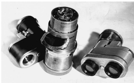
Fig. 4 : l'objectif de prise de vues et ses têtes amovibles correspondant aux différentes focales, Source : collection Alain Roux.

Par ailleurs, les projecteurs étaient équipés de lanternes à arc, si le réglage du miroir était défectueux, les quatre images n'étaient pas uniformément éclairées, une dominante de couleur apparaissait, l'usure en sifflet du cratère du charbon produisait le même effet. Ce sont là les principales difficultés de l'exploitation d'un film en additif, ce qui justifie le tirage de copies sur films à couches. Une telle solution fait perdre au procédé son originalité et ses qualités dues à la quadrichromie puisque l'on passe par un trichrome soustractif. Mais cette alternative existait et elle consistait à « coucher » directement les quatre images au moyen d'une tireuse additive, construite entièrement dans les ateliers de la Société Arco (Appareils Roux de Cinématographie et Optique) et permettait de tirer des copies sur positif Gévacolor ou Eastmancolor. Ceci fut notamment utilisé pour l'exploitation à l'étranger, ou d'un court métrage complément d'un long métrage en noir et blanc. Munie de bande cache à quatre trous de lumière, cette tireuse permettait aussi de faire des corrections chromatiques [Fig. xxxix, cahier couleur].