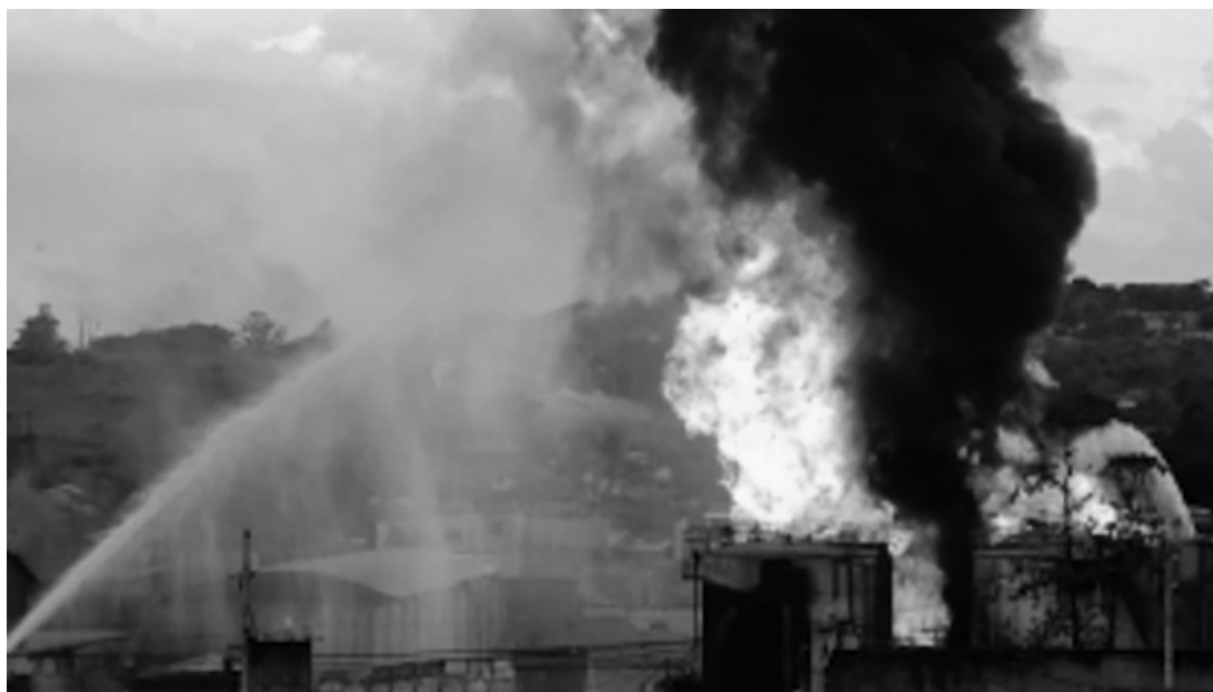
Incendie du dépôt de la Cinemateca brasileira, 3 février 2016..