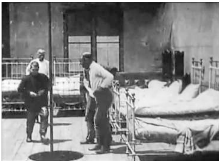
Capture d'écran du film Life of an American Fireman (Edison, 1903)

Les boîtes sont peintes en rouge, afin d'être vues de loin ; elles sont placées sur des perches, de quinze à seize mètres de hauteur, également peintes (...). Sur chaque boîte se trouve placée une consigne ou avis pour son usage, et l'indication du dépôt le plus proche d'une clef.