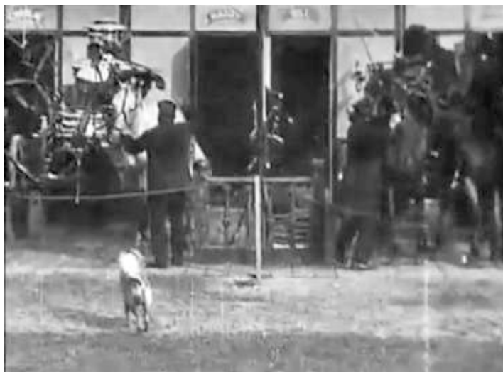
Capture d'écran du film Life of an American Fireman (Edison, 1903)

Scène 4. Intérieur de la salle de la caserne, les chevaux bondissent de leurs stalles et sont conduits aux attelages. C'est peut-être la plus palpitante et la plus merveilleuse des sept scènes de cette série, car c'est résolument le premier film jamais fait représentant le véritable endroit où l'on attelle les chevaux aux voitures anti-incendie. Tandis que les pompiers glissent le long de la rampe comme décrit dans la scène ci-dessus et atterrissent sur le sol à la vitesse de l'éclair, six portes à l'arrière de la caserne, chacune donnant sur une stalle, s'ouvrent simultanément et des chevaux impressionnants, têtes hautes, prêts à s'élancer jusqu'au site du sinistre, surgissent. Allant immédiatement vers leur harnais, ils sont équipés dans le temps à peine croyable de cinq secondes et prêts à partir vers l'incendie. (...)