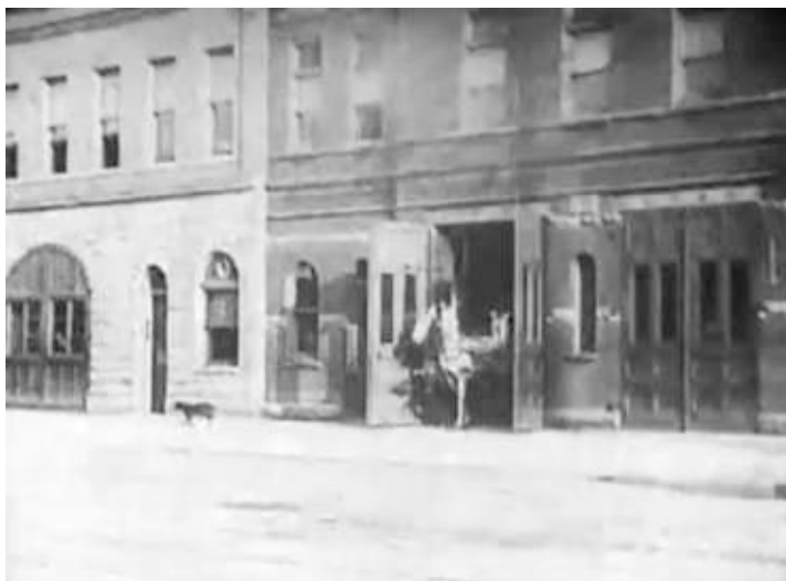
Capture d'écran du film Life of an American Fireman (Edison, 1903)

La ville a fait construire sur des terrains qu'elle s'était réservés dans ce but tous les édifices occupés par le département du feu, savoir : un quartier général avec la tour de la sonnerie générale d'alarme, vingt-trois stations avec écuries pour les vingt-trois compagnies de pompes, de tuyaux et d'échelles,