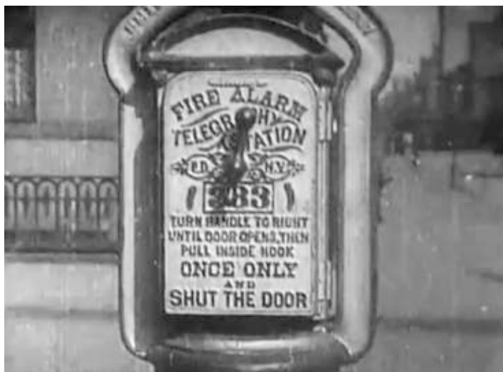
Capture d'écran du film Life of an American Fireman (Edison, 1903)

Une vue rapprochée d'une boîte d'alarme-incendie de New York. On montre les inscriptions et chaque détail sur la porte de la boîte, ainsi que le moyen de faire fonctionner l'alarme. Un passant s'arrête ensuite devant la boîte, ouvre rapidement la porte et tire le crochet, envoyant ainsi le courant électrique qui alerte des centaines de pompiers et appelle donc sur le lieu de l'incendie le merveilleux dispositif anti-incendie utilisé par les casernes des grandes villes.