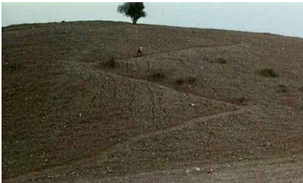
Figura 5 – Ahmed indo em direção ao vilarejo Poshter