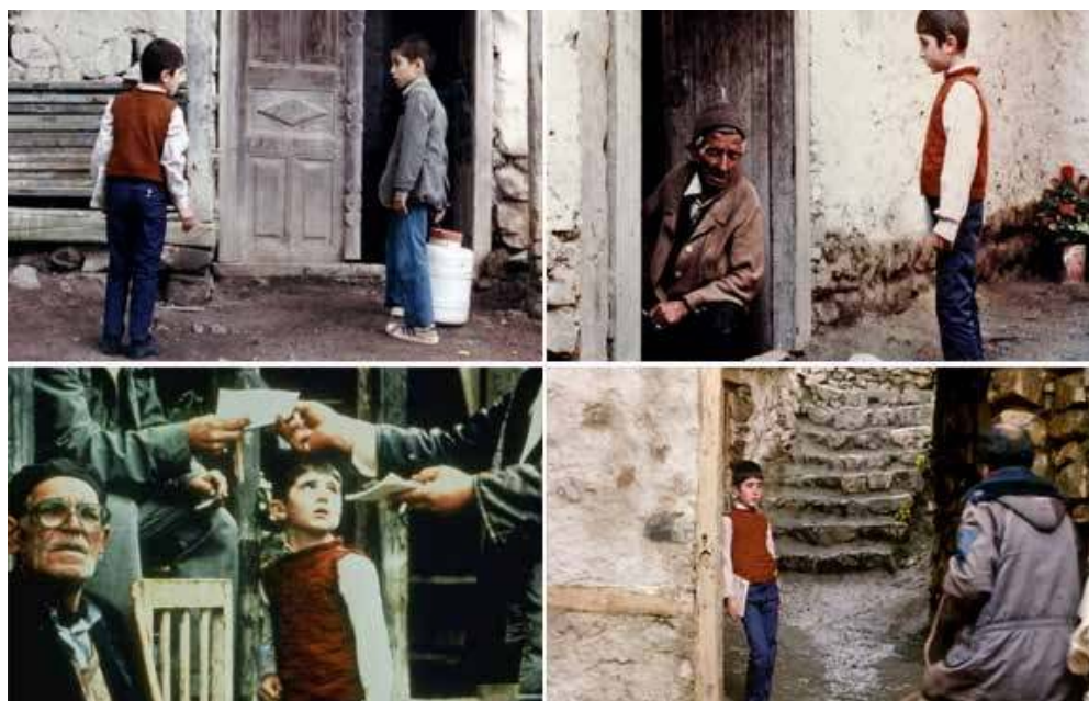
Figura 8 – A cadeia de relações sociais que Ahmed faz para entregar o caderno de seu amigo

A jornada de Ahmed e o seu objetivo não se finalizam com êxito, no entanto, o menino já não é o mesmo. As pessoas que ele encontra, a movimentação que faz e as relações que estabelece culminam em uma aprendizagem. Para Ramon Sarró (2009), falar dos deslocamentos como aventura é colocar sujeitos (e aqui poderíamos também pensar em objetos) como agentes que permitem a comunicação entre mundos e espaços que não se conhecem, mas se tornam conectados. Nesse sentido, Ahmed “não é a fonte de um alvo e sim o alvo móvel de um amplo conjunto de entidades que enxameiam em sua direção” (Latour, 2012:75).