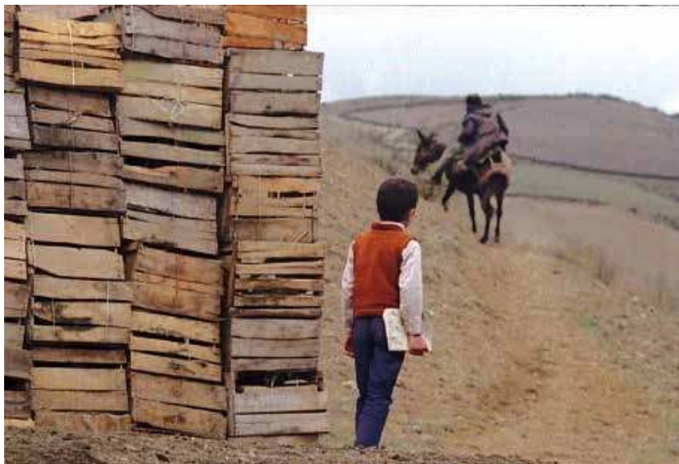
Figura 6 – Ahmed seguindo um provável parente de Mohammed

Em certos pontos da narrativa fílmica, Kiarostami insere elementos como a calça e o sobrenome de um desconhecido como ícones para que Ahmed fale de sua relação com o amigo, sendo necessário reiterar, para cada pessoa que encontra, o fato de que precisa devolver o caderno. O simbólico aqui utilizado é o “objeto, ato, acontecimento, qualidade ou relação que serve como veículo a uma concepção” (Geertz, 2008:67). Tanto a calça quanto o sobrenome de um desconhecido funcionam como uma forma de Ahmed falar de sua relação com o amigo, mas também são fontes de informação para o menino na medida em que são as únicas pistas que o fazem achar que está próximo de concretizar a sua jornada – ou seja, criam novas relações.