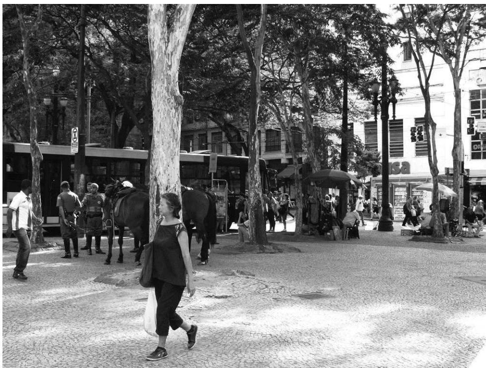
Figura 5: Vista sudoeste da praça a partir de seu setor triangular, outubro de 2013