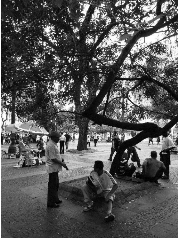
Figura 4: Vista nordeste da praça a partir de seu setor retangular sombreado, outubro de 2013