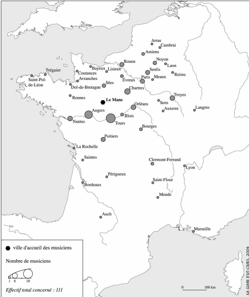
Figure 3 – Diocèses d'origine des musiciens employés à Saint-Pierre-la-Cour (Le Mans) de 1650 à 1790

Autre parenté entre les deux cartes : la présence sur chacune d'elles d'un musicien né à Maastricht. N'imaginons pas une filière hollandaise ! Il s'agit en réalité du même homme, Philippe Van Arcken, basse-contre, que l'on rencontre tour à tour dans plusieurs villes de l'Ouest : recruté une première fois en 1773 à la cathédrale d'Angers, il n'y reste que deux ans. J'ignore où il s'en va alors. Il est reçu à Saint-Hilaire de Poitiers en octobre 1784, puis en mars 1785 à nouveau à Saint-Maurice d'Angers, non sans quelques réticences 47 . Un an plus tard il est embauché à la cathédrale