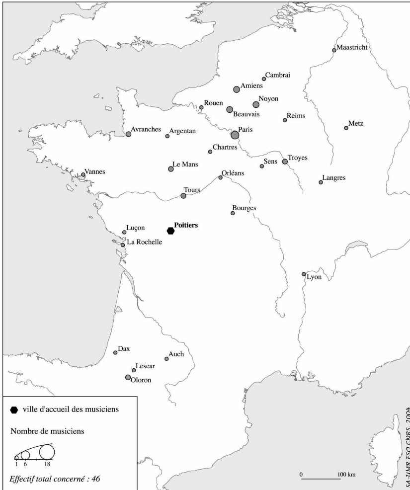
Figure 5 – Diocèses d'origine des musiciens employés à Saint-Hilaire de Poitiers de 1750 à 1790

Le recrutement de la cathédrale angevine semble se répartir de manière plus équilibrée sur l'ensemble des régions allant des marges de la Bretagne à la Meuse. Le chapitre fait régulièrement appel aux diocèses qui l'entourent (6 musiciens viennent de celui du Mans, dont un de Laval, 4 viennent de Nantes, 3 de Luçon, 3 de Tours...). Alors qu'à l'inverse on a l'impression que Saint-Hilaire néglige les ressources du voisinage et attire à lui des musiciens venus d'au-delà de la Loire (5 de Chartres, 5 de Paris, 3 de Beauvais, Amiens, Noyon...).