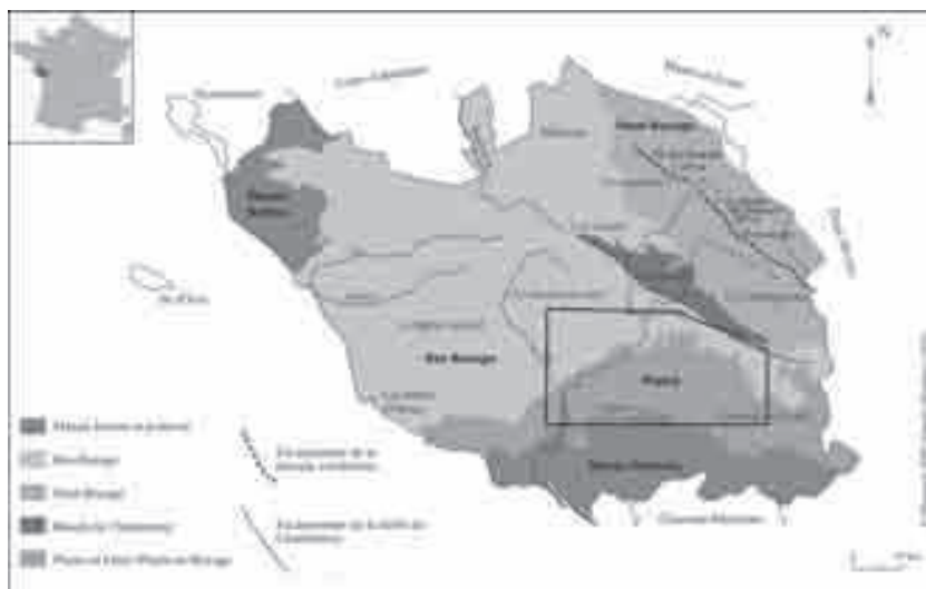
Figure 1 – Localisation de la zone d'étude en Vendée