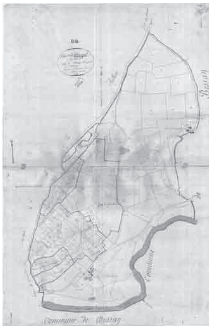
Figure 9 – Parcelles de métairies et de borderies à l'est de Mareuil-sur-Lay sur le cadastre napoléonien (section B1 du Bourg, 1820)