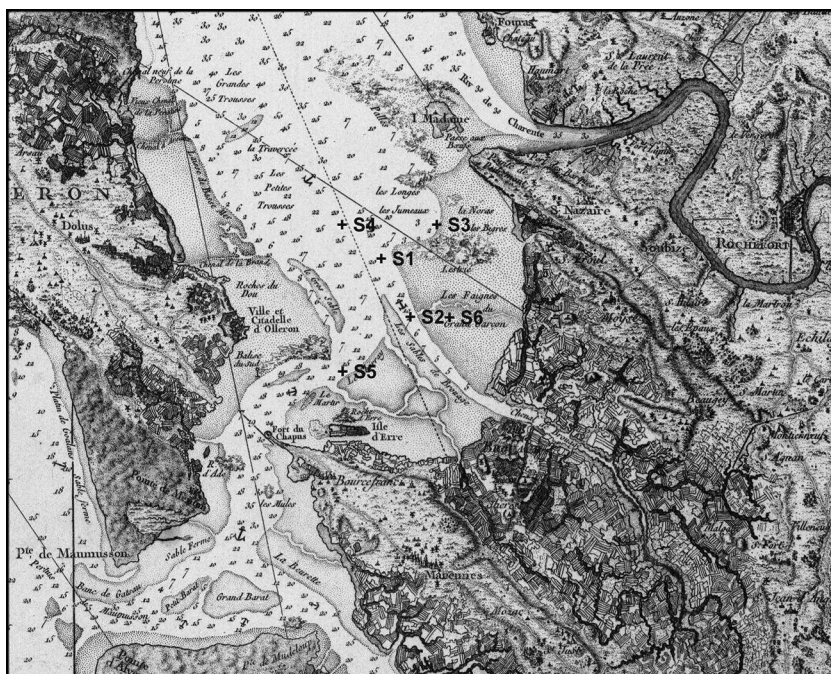
Figure 1 – Itinéraire suivi par la chaloupe durant la mission du 1 er avril 1665 (S 1 à S 6 )

Dans le document, les sondages sont malheureusement dépourvus d'indications horaires. Il convient donc d'estimer celles-ci en fonction du seul trajet pour lequel nous sommes renseignés, celui effectué entre le point de départ à Brouage (0) et le premier sondage (S 1 ). Sur ce trajet (0-S 1 ), le navire a dû avancer contre le vent de nord-ouest, situation