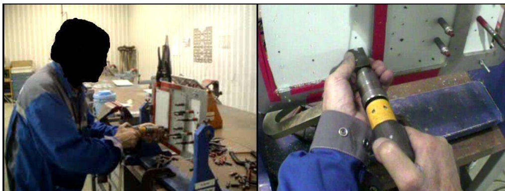
Figure 2 : Exemple de rendu vidéo après montage des films issus des deux caméras (Externe : à gauche, Subjective : à droite)