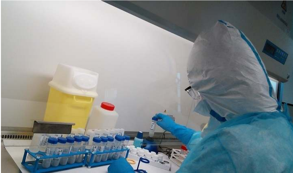
Figure 4 : Le travail sous le PSM. Figure 4: Work under a safety cabinet