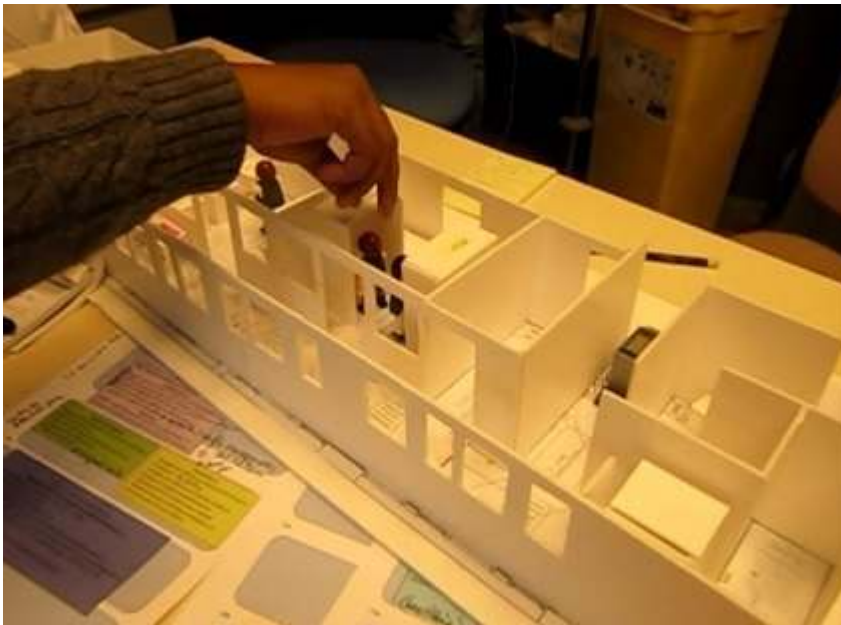
Figure 3: Simulation on the three-dimensional model and paper supports for the organizational simulation

Figure 3 : Simulation sur la maquette tridimensionnelle et supports papier pour la simulation organisationnelle.