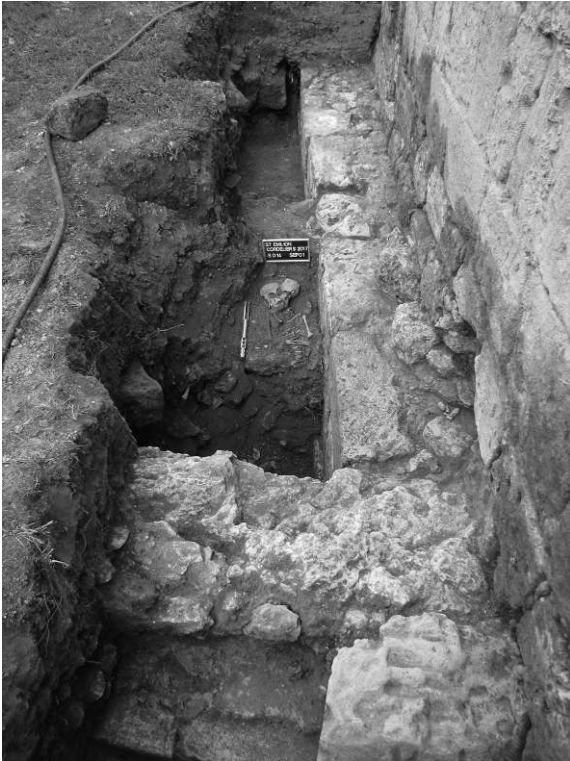
Fig. 2 – Mur antérieur à l'édification de l'église et sépulture d'enfant aménagée dans les gravats