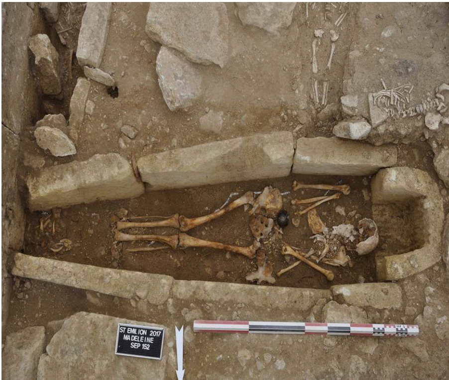
Fig. 1 – Sépulture 152 comportant le dépôt d'un orcel