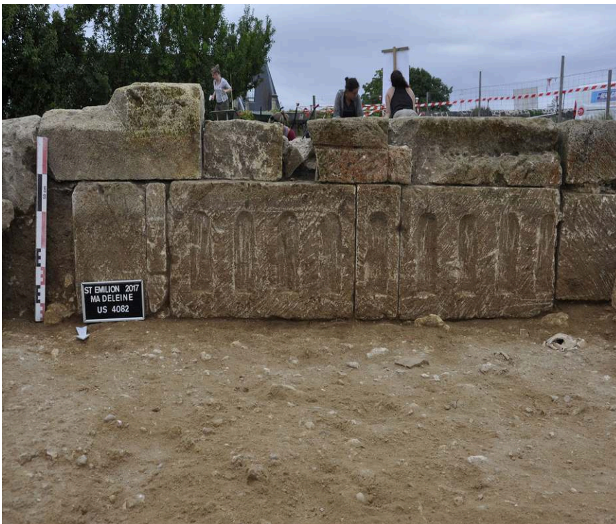
Fig. 3 – Support décoré de glyphes

Levé topographique : S. Malpelat, complété par N. Sauvaître (Hadès).