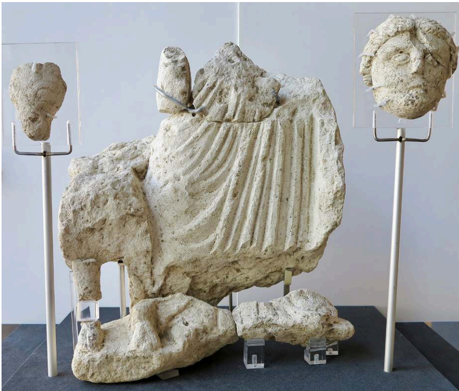
Fig. 2 – Epona, exposition au musée d'Agesci, 2018