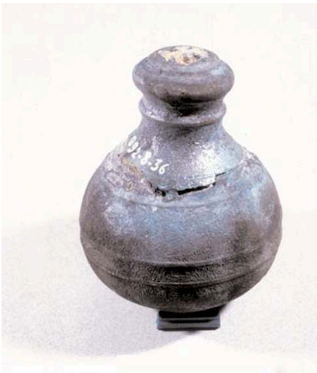
Fig. 7 – Poids de balance en plomb recouvert de cuivre