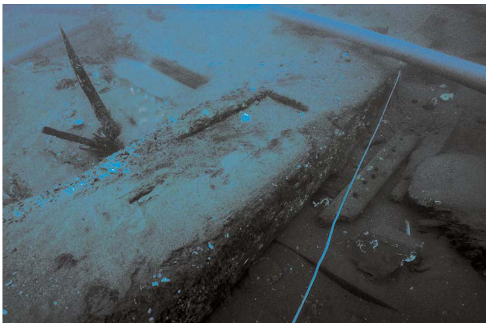
Fig. 1 – Carlingue taillée pour l'emplanture du mat