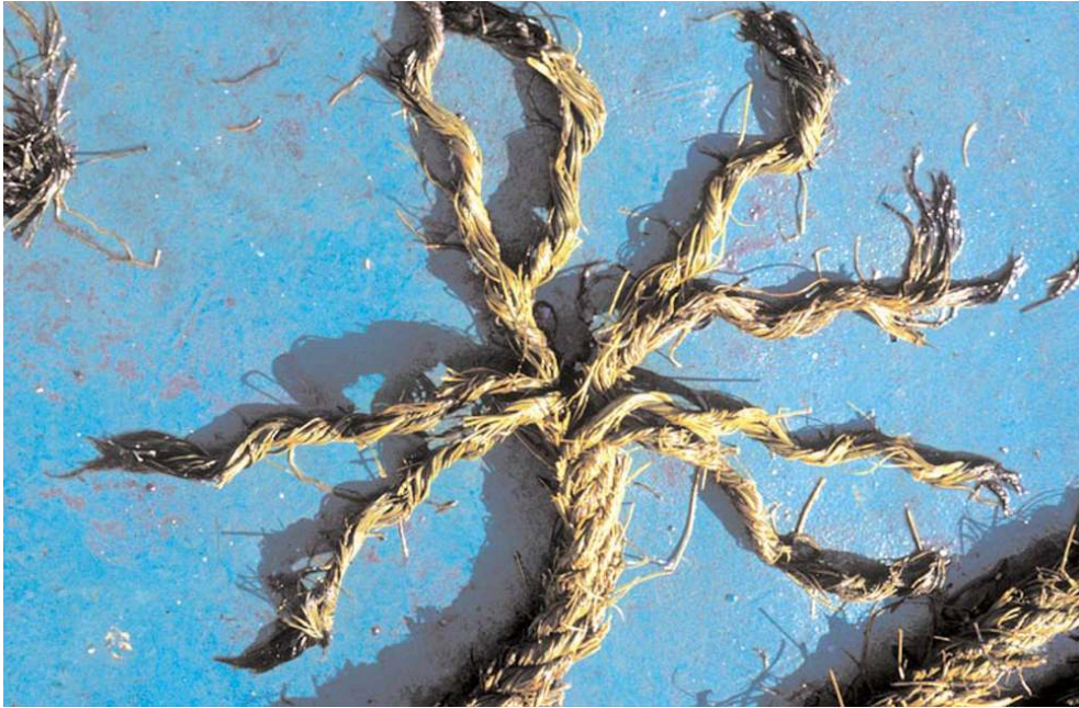
Fig. 6 – Le toron se compose de huit brins tressés