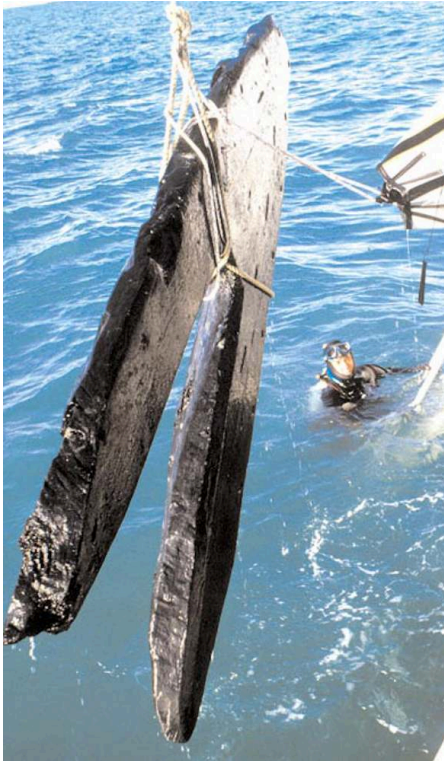
Fig. 2 – Levage du bouclier d'étrave