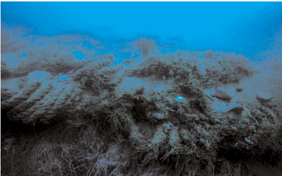
Fig. 5 – Chargement de l'épave constitué de ballots de corde