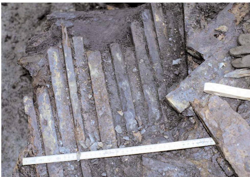
Fig. 4 – Étude détaillée de la disposition des lingots