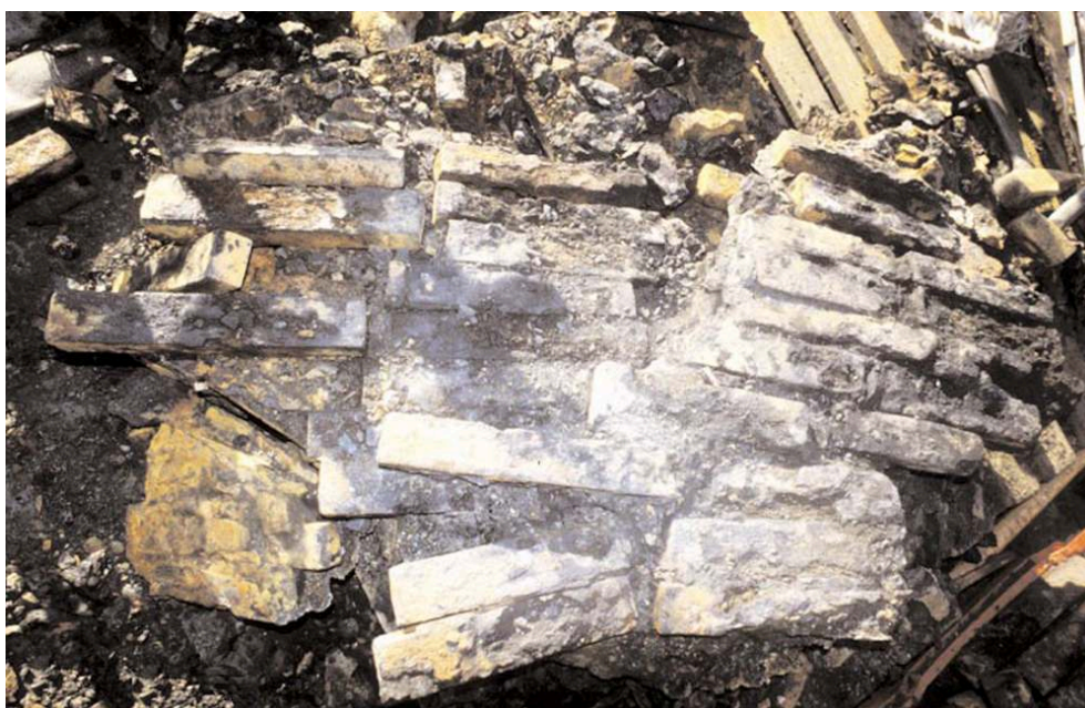
Fig. 3 – Dégagement des lingots