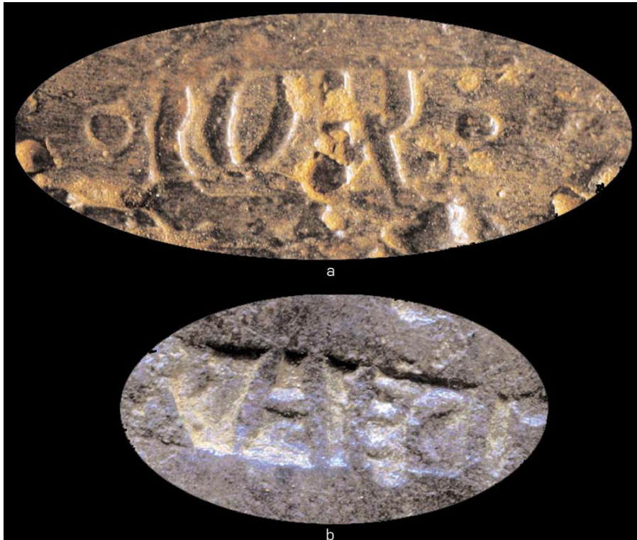
Fig. 5 – a, marque COR. sur lingot de fer ; b, marque CAECI

gisement, a livré un glaive encore conservé dans son fourreau en bois, dont la poignée, brisée au niveau de la garde, est manquante (fig. 6a et 6b). Cet objet, pris en charge par le musée de l'Arles antique, fut immédiatement transporté au laboratoire de Draguignan, pour traitement et restauration. D'après les premières observations, la partie conservée de la garde et des éléments de suspension étaient peut-être façonnés dans un métal argenté comme sur les glaives provenant de Rheingönnheim sur le Rhin.