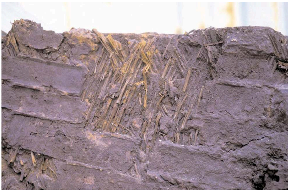
Fig. 2 – Vue de détail des empreintes de lingots posés sur des sarments de vigne