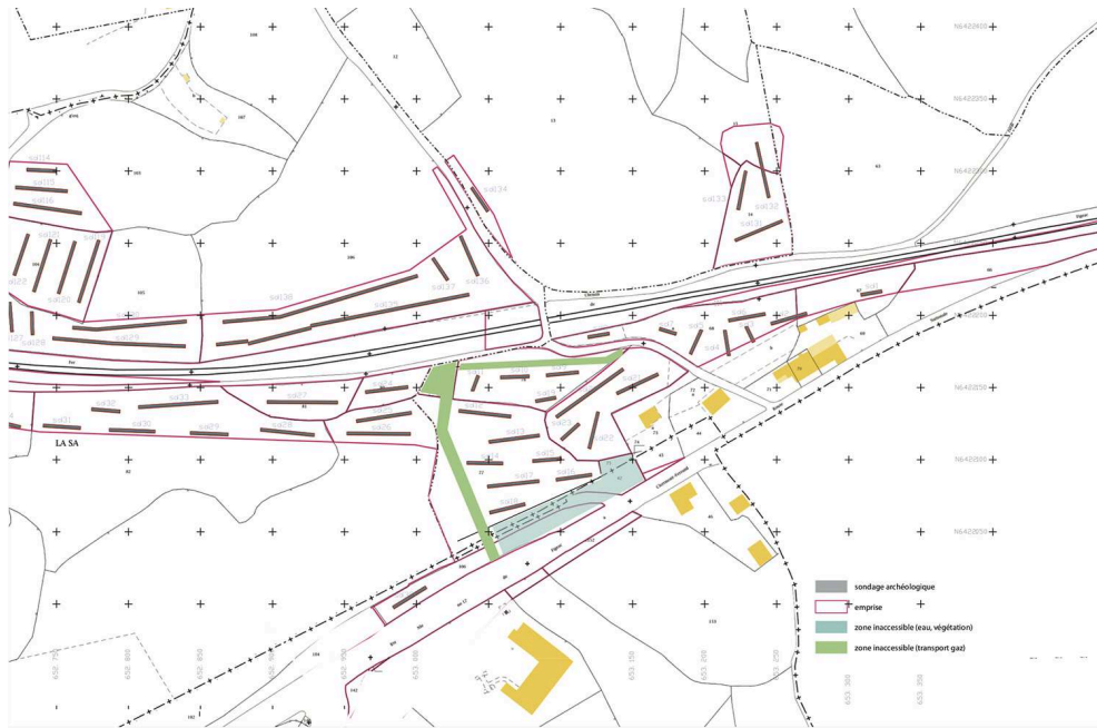
Fig. 1 – Localisation des sondages (partie est de l'emprise)