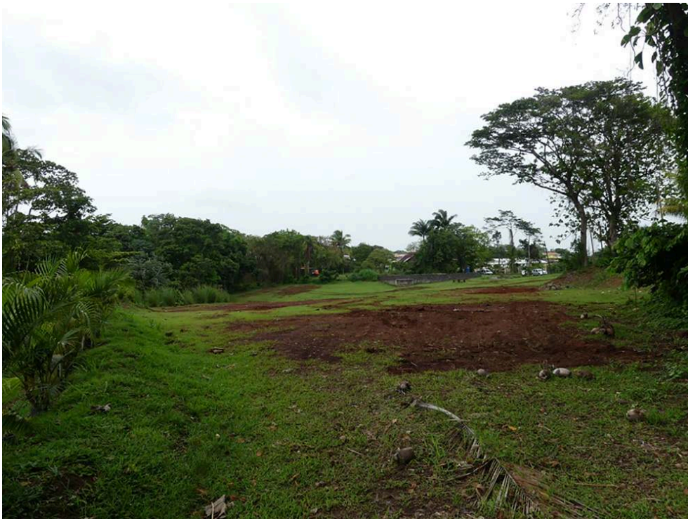
Fig. 2 – Vue générale des sondages

DAO: P-Y. Devillers, S. Delpech (Inrap).