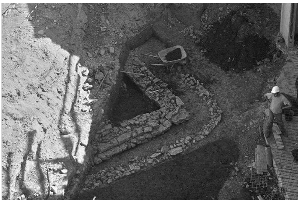
Fig. n°3 : Les constructions mérovingiennes en fin de fouille