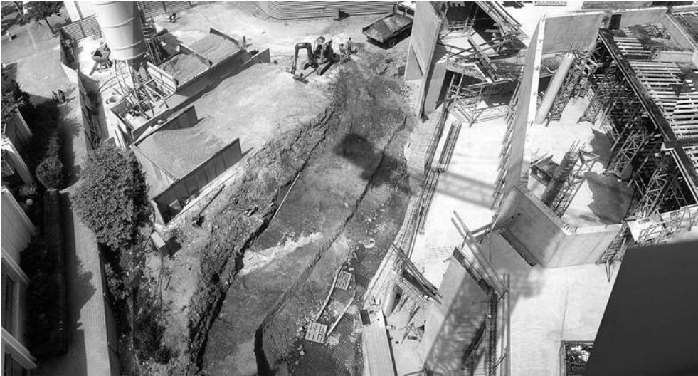
Fig. n°1 : Environnement de la fouille (au centre), vu depuis l'est. À gauche, l'extrémité du bâtiment thermal. À droite, le casino de jeu en cours de construction