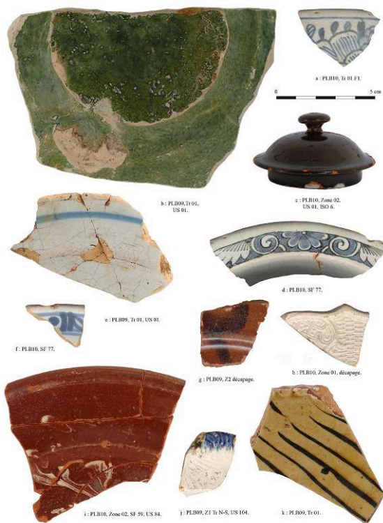
Fig. 2 – Céramiques coloniales