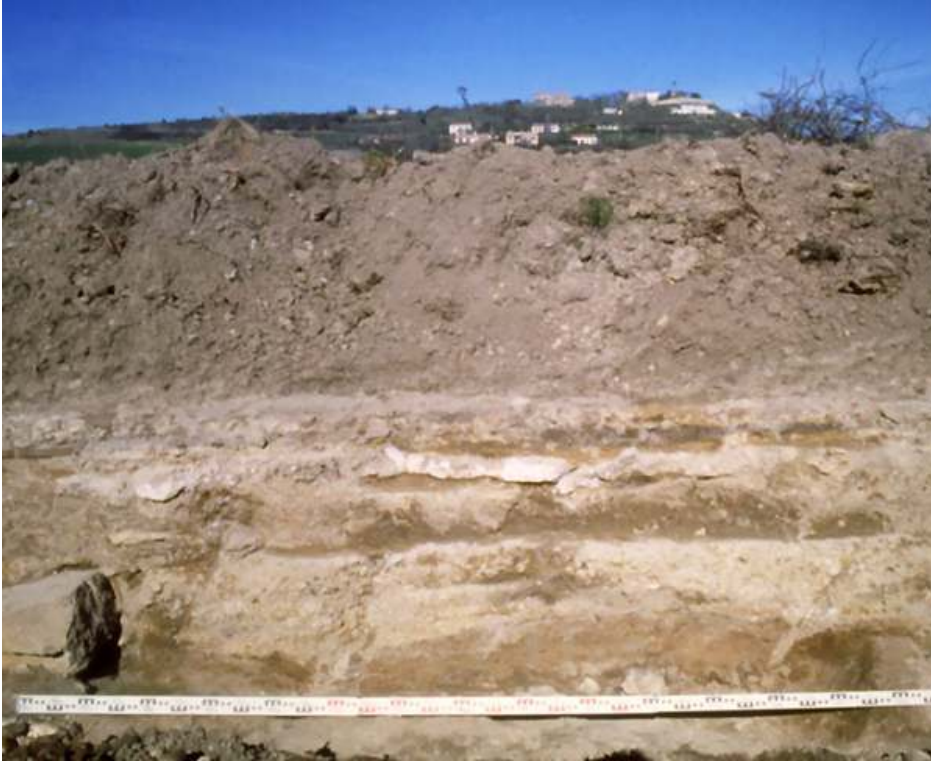
Fig. n°3 : Stratigraphie d'un espace de circulation (passage) au bord de la voie, entre les points 18 et 19

Auteur(s) : Passelac, Michel. Crédits : ADLFI - Passelac, Michel (2003)