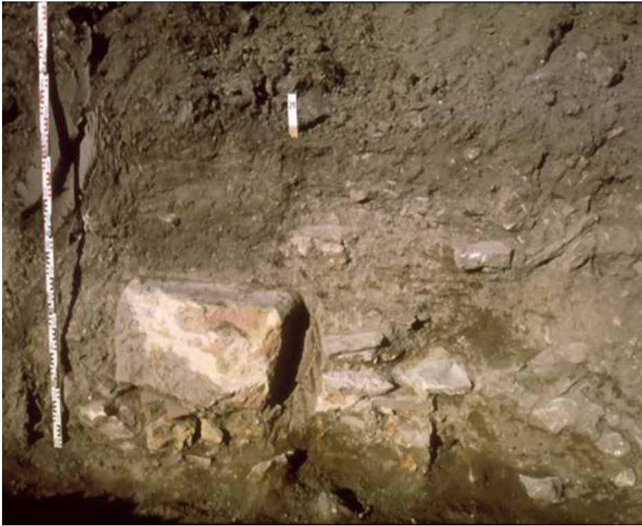
Fig. n°4 : Soubassement de mur en terre et bois et dé de pierre au point 21

Auteur(s) : Passelac, Michel. Crédits : ADLFI - Passelac, Michel (2003)