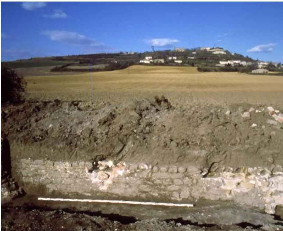
Fig. n°2 : Mur de façade du bâtiment est, entre les points 8 et 9

Auteur(s) : Passelac, Michel. Crédits : ADLFI - Passelac, Michel (2003)