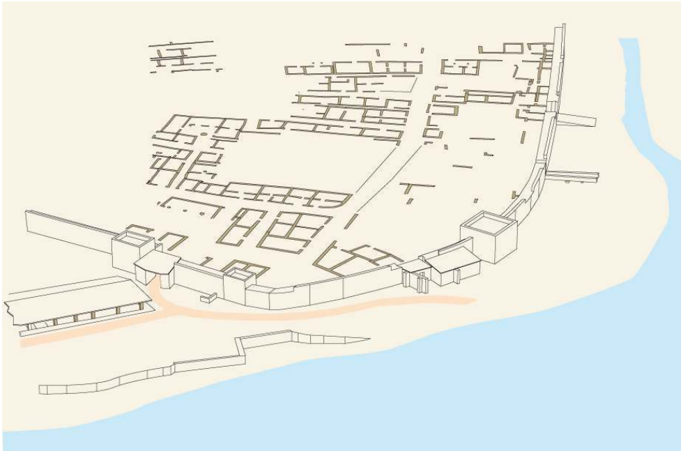
Fig. n°6 : Proposition de restitution de l'angle sud-est de l'enceinte de Lattes au début de notre ère.

Auteur(s) : Ufral.