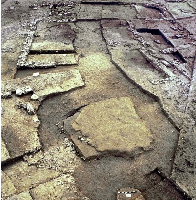
Auteur(s) : Ufral. Crédits : ADLFI (2004)