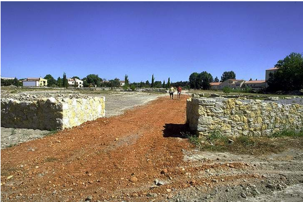
Auteur(s) : Ufral. Crédits : ADLFI (2004)