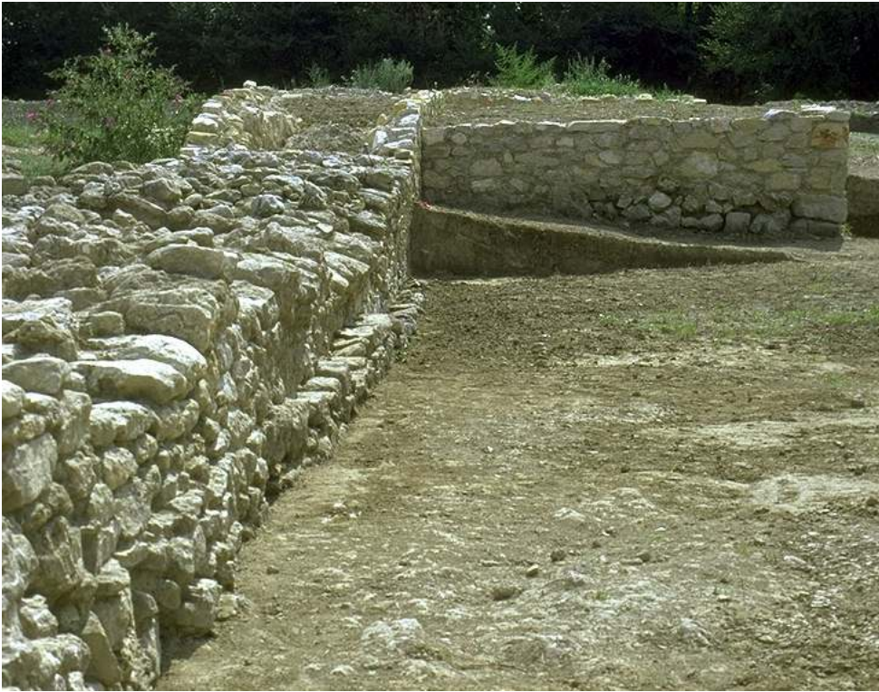
Fig. n°4 : La tour T2 et la courtine sud-ouest conservée en élévation, vus de l'ouest.