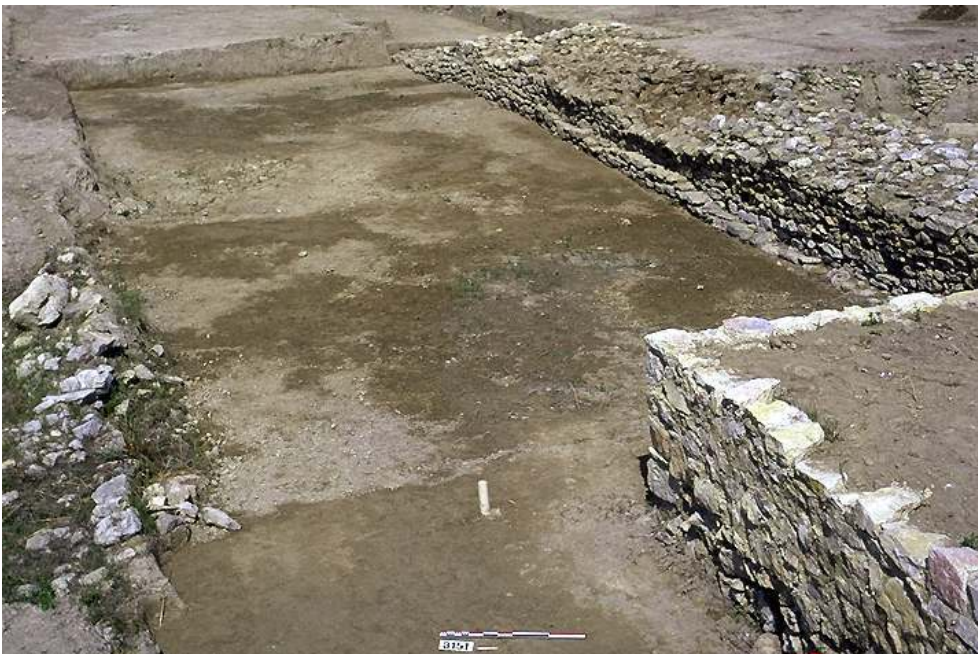
Fig. n°5 : Courtine sud-ouest de l'enceinte montrant la succession de deux murs, le plus ancien (fin du VI e s.) débordant légèrement vers l'extérieur par rapport au plus récent (milieu V e s.).