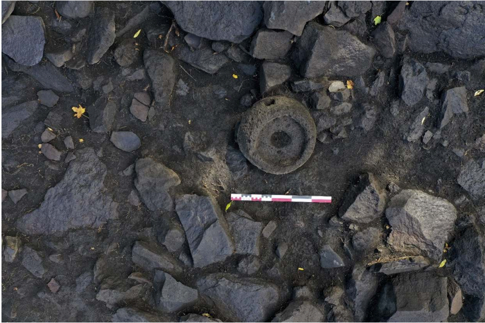
Fig. 3 – Vue zénithale du catillus en place dans le comblement du fait n° 7