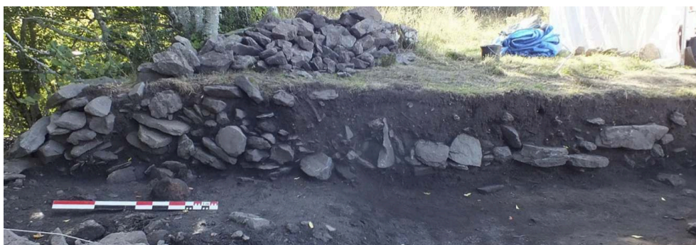
Fig. 1 – Vue du rempart en coupe associé avec le canal et la voie de circulation (correspondant à la coupe n° 2)