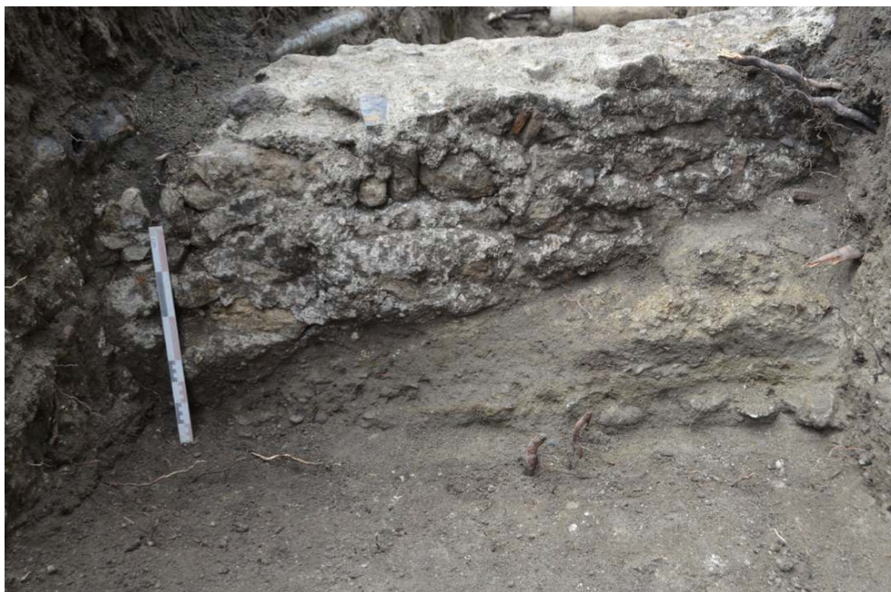
Fig. 3 – Sondage 3 : les niveaux de sols de F6 contre le parement du mur F5

fosses et de remblais en partie arasés par les fondations de la période moderne (SD3 et SD4). La partie ouest, mieux préservée par l'absence de constructions postérieures, révèle une succession de niveaux de sol et plusieurs murs (fig. 3). Ces vestiges n'ont pas été clairement caractérisés. Malgré la proximité avec le captage antique de la source de l'hôpital, le mobilier renvoie à la sphère domestique.