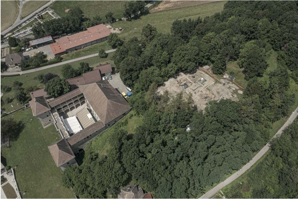
Fig. 2 – Fouille de la cour haute et du secteur résidentiel