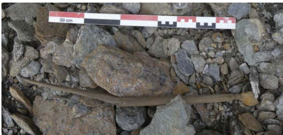
Fig. 3 – Fragment de probable arc