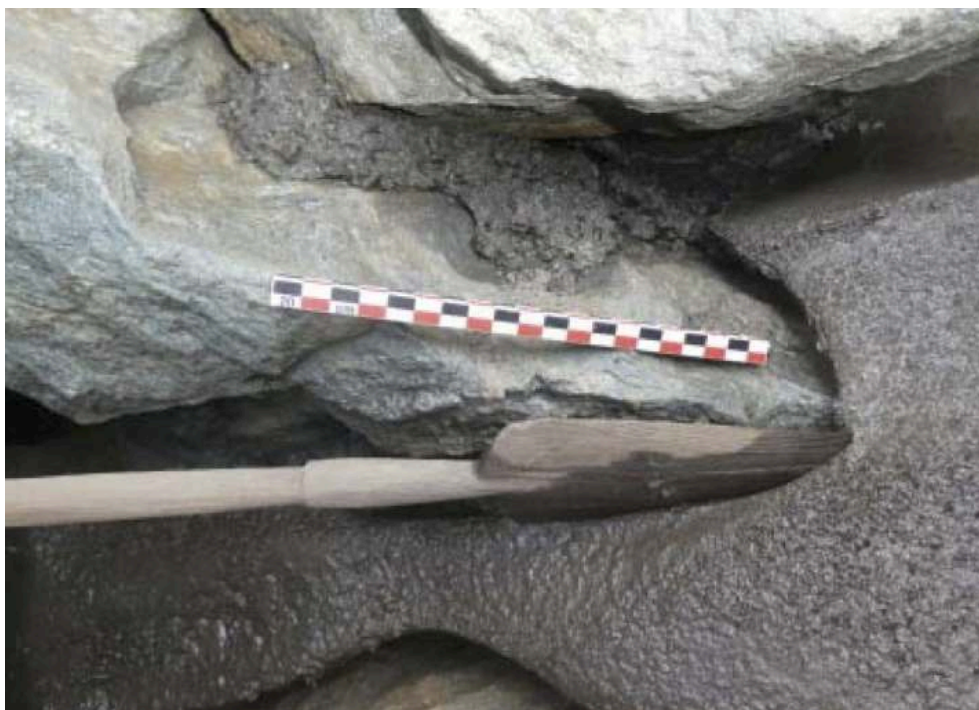
Fig. 2 – Objet n° 722, lance monoxyle, vues en place, la pointe prise dans la glace