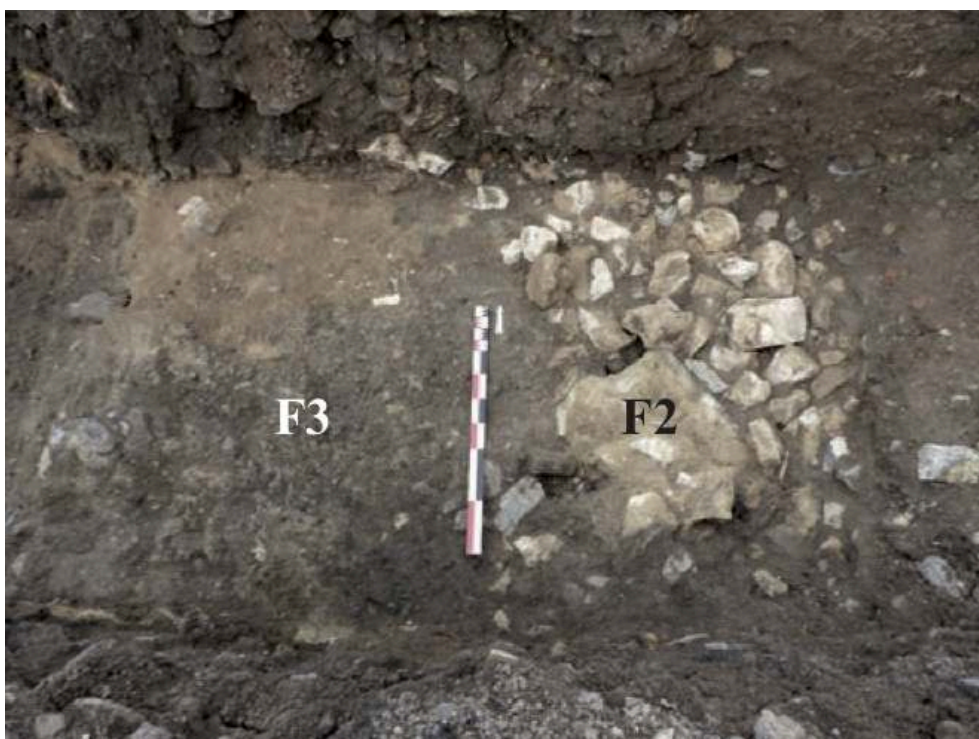
Fig. 3 – Vue de la maçonnerie F2 et du sol de terre battue F3 (sondage 4)