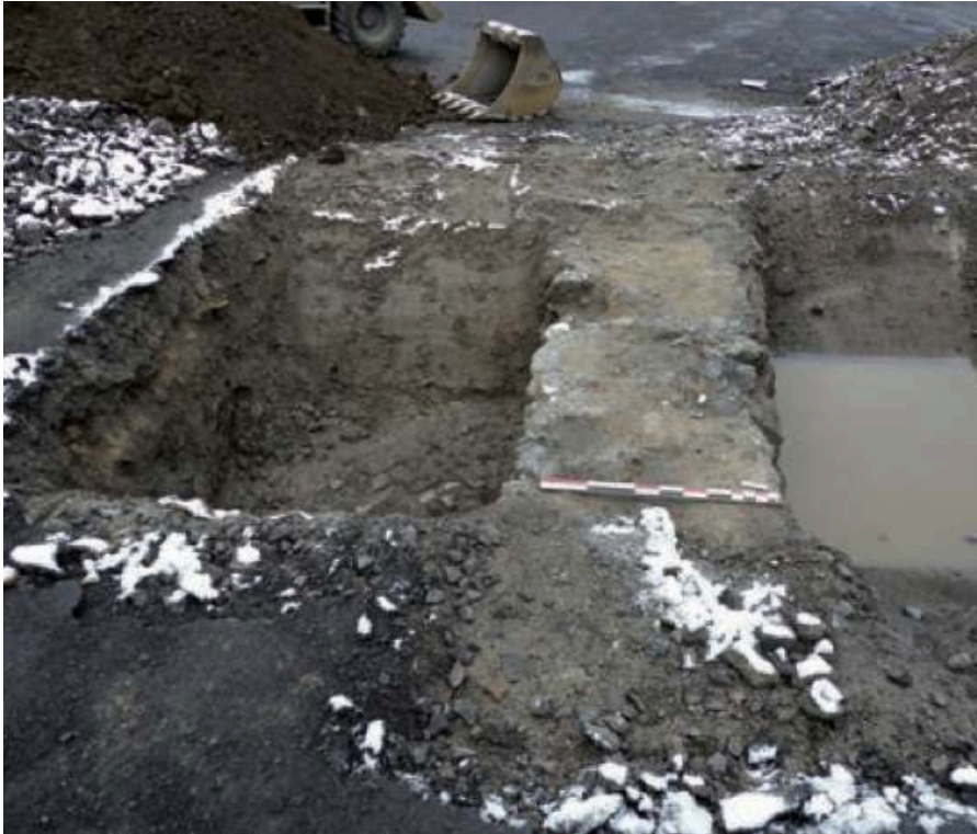
Fig. 2 – Section de la courtine de la forteresse abbatiale (sondage 1)