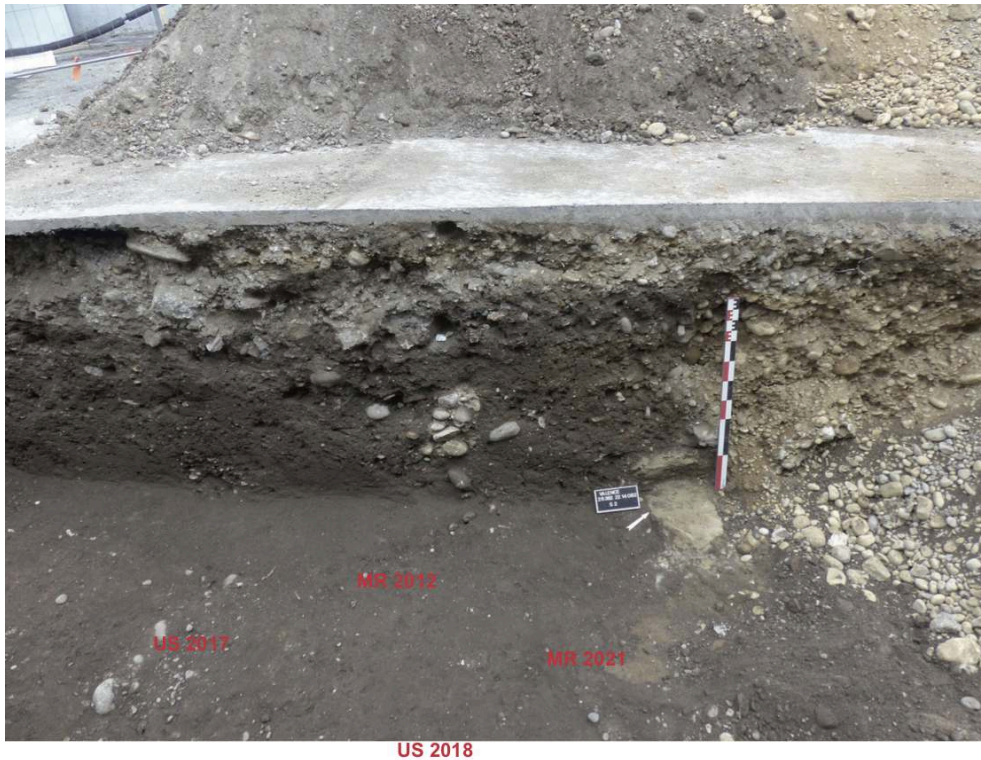
Fig. 5 – Vue générale du sondage 2 pris de l'est