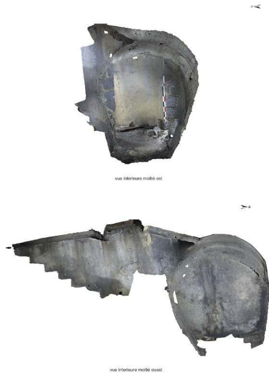
Fig. 4 – Galerie de défense passive de 1941, MR 1022

Vue en 3D de l'intérieur de la moitié est de la galerie et vue intérieure de sa moitié ouest.