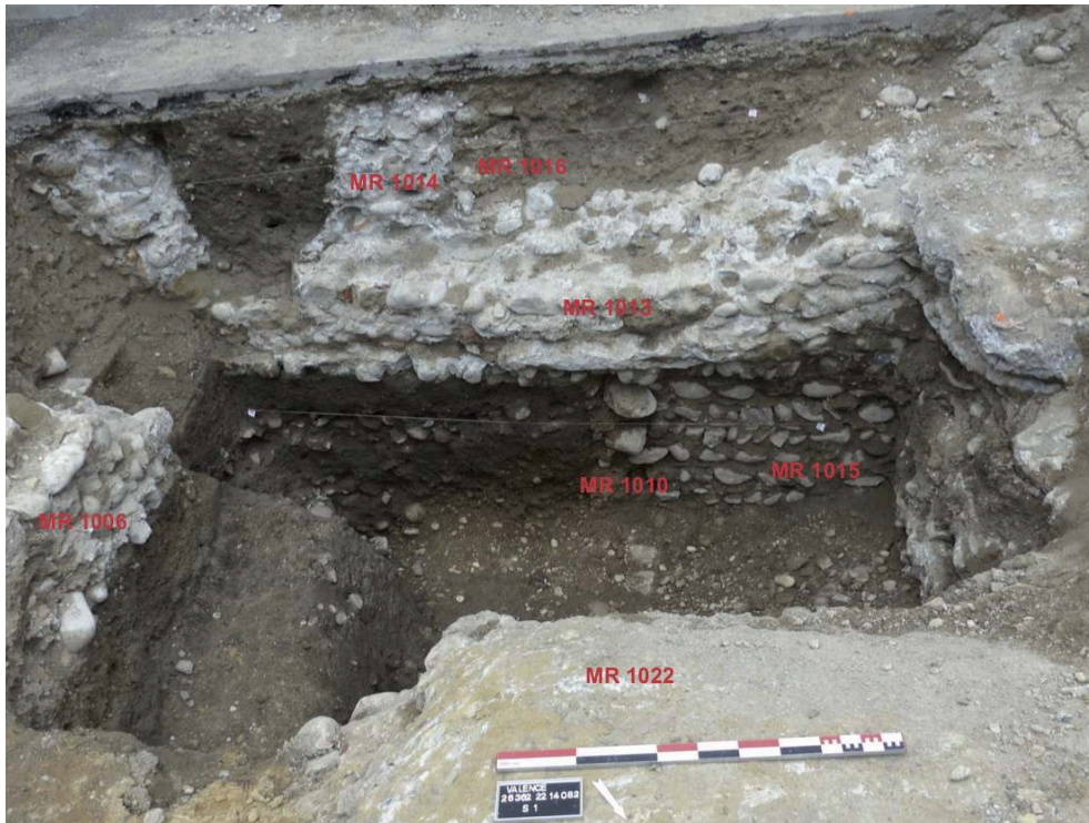
Fig. 2 – Vue générale du sondage 1 pris du nord