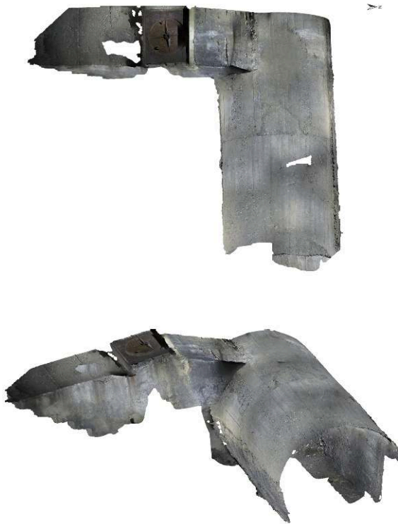
Fig. 3 – Galerie de défense passive de 1941, MR 1022

Extrait de modélisation 3D de l'abri de défense passive, moitié ouest, avec son entrée. Photogrammétrie : H. Jaudon (Inrap).