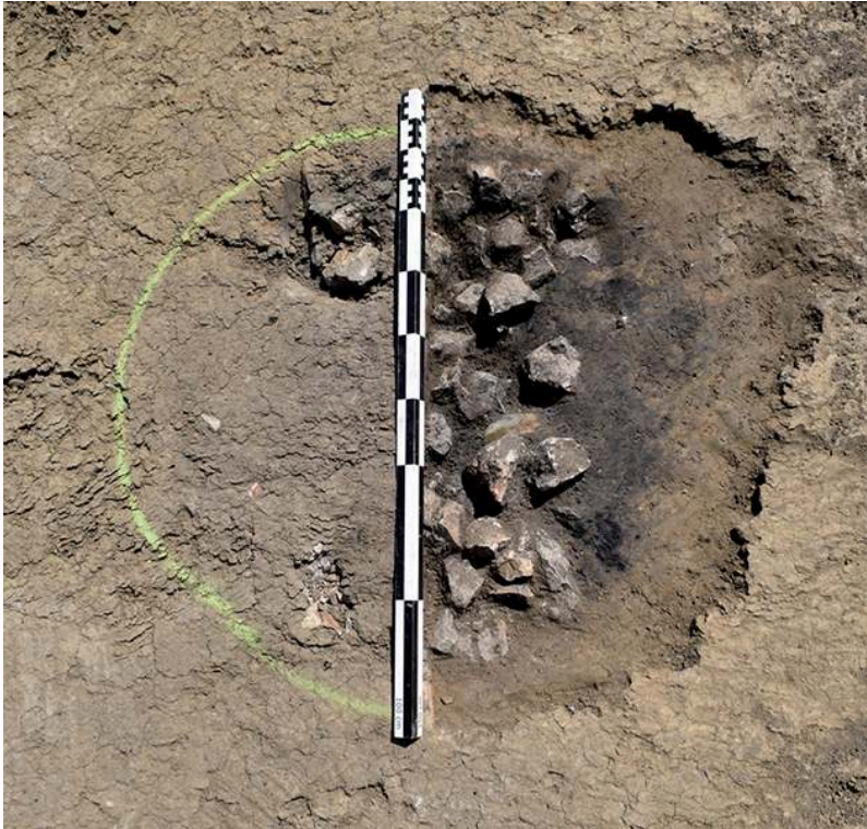
Fig. 2 – Vue zénithale de la structure à pierres chauffées en cours de fouille