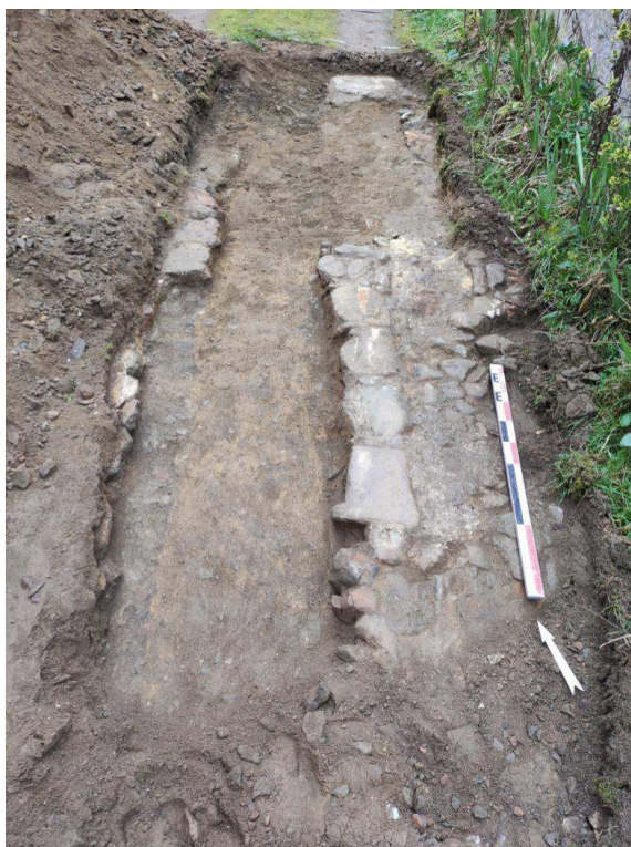
Sondage 3, rue du faubourg de la Varenne.