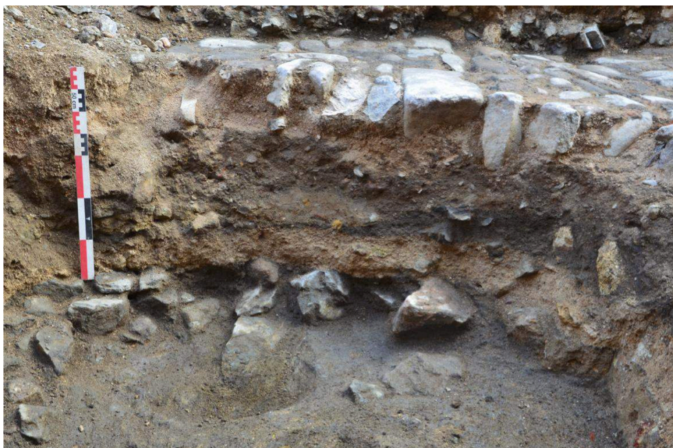
Sondage 1, place de la République.