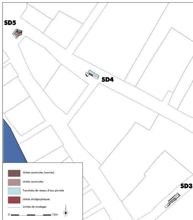
Fig. 2 – Implantation des sondages 3, 4 et 5

Rue du faubourg de la Varenne, rue Tardy et à l'angle de la rue Tardy et de la rue des Cueils. DAO : M. Labalme (Sapda).