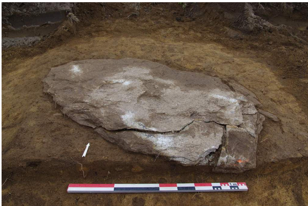
Fig. 1 – Premier bloc après nettoyage

Vue depuis le sud.