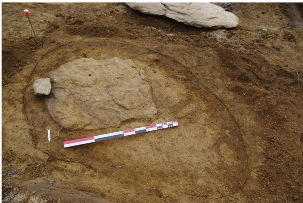
Fig. 2 – Second bloc après nettoyage et empreinte du premier

Vue depuis le sud.