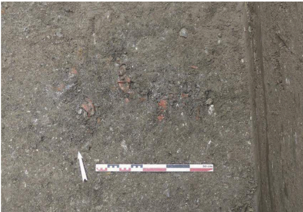
Fig. 3 – Dépôt secondaire de crémation F7.2