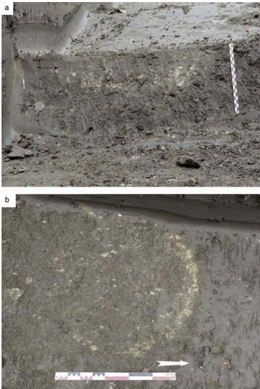
Fig. 2 – a, Vue en coupe de la fosse F8.1 ; b, Vue en coupe de la fosse F12.1