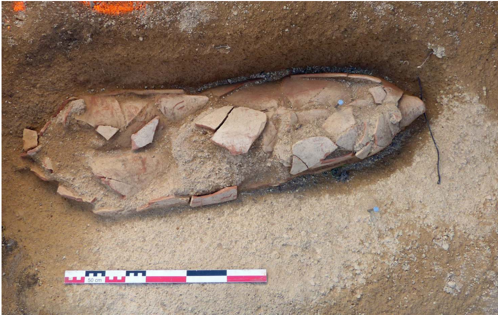
Fig. 3 – SP1052, VUE VERS LE SUD