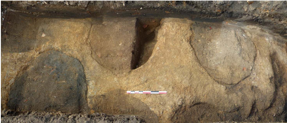
Fig. 2 – ENSEMBLE DES FOSSES DE LA TRANCHÉE TR19, VUE VERS L'OUEST