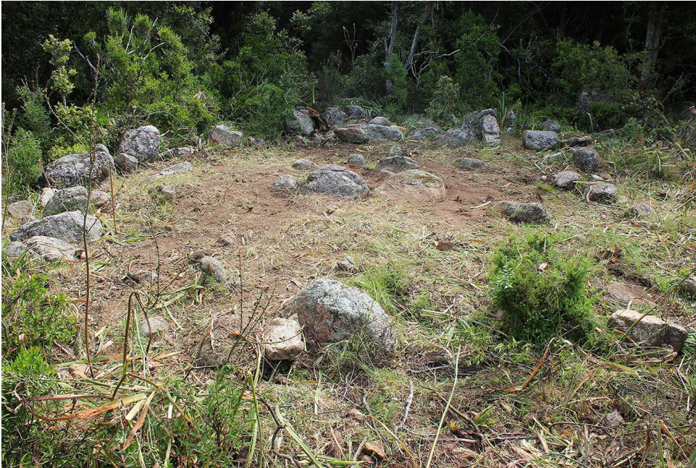
Fig. 1 – Cercle de pierre D