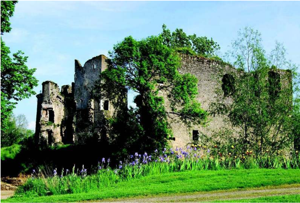
Fig. n°1 : Château