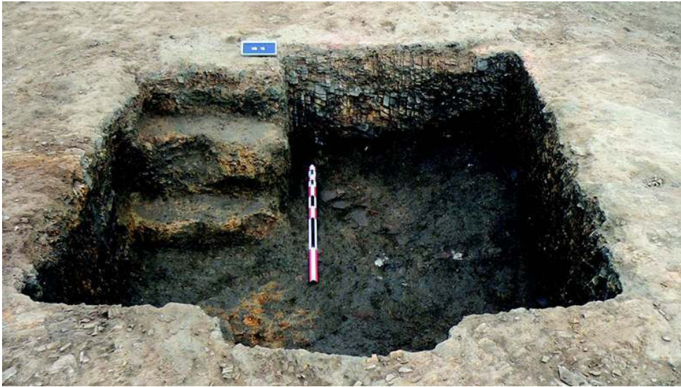
Fig. n°2 : Cave 2