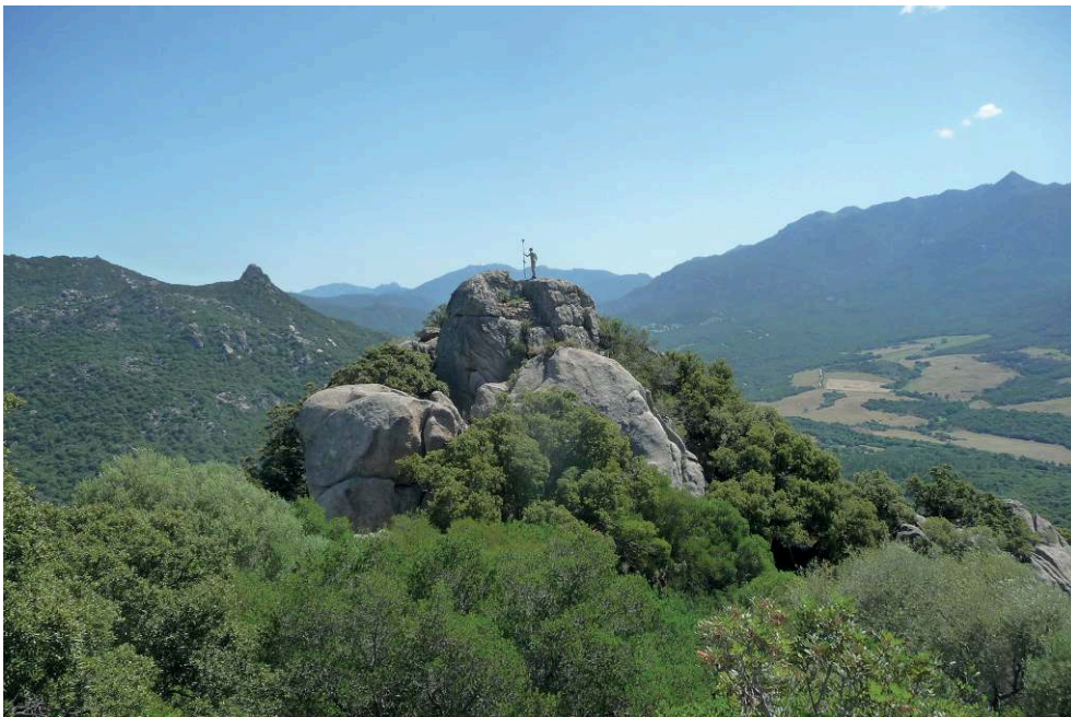
Fig. 2 – Relevés topographiques sur le rocher fortifié au nord-est