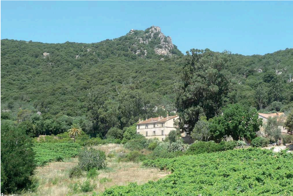
Fig. 1 – Le site de Litala vu de la vallée de l'Ortolo