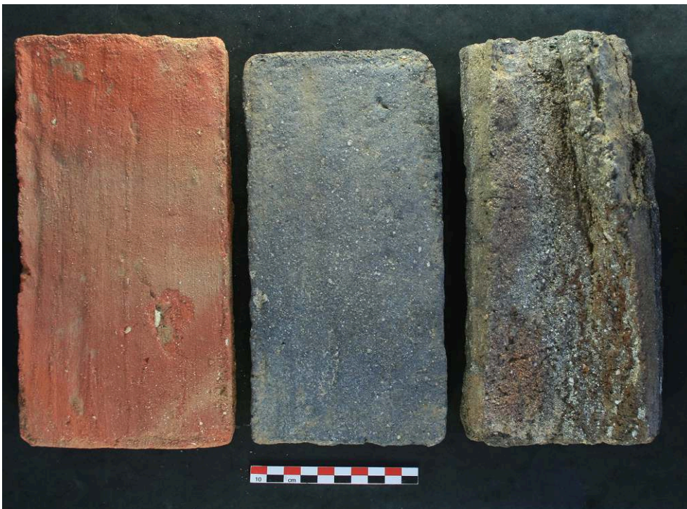
Fig. 2 – Briques plus ou moins surcuites