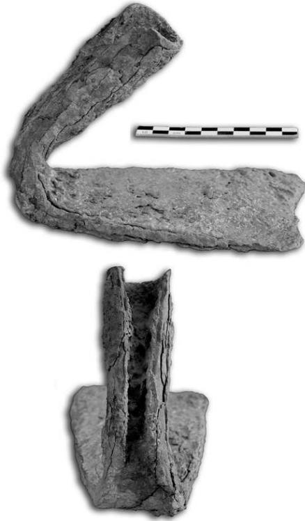
Fig. n°1 : Photographie de la houe découverte dans le niveau de démolition de l'habitat des III e s.-IV e s.