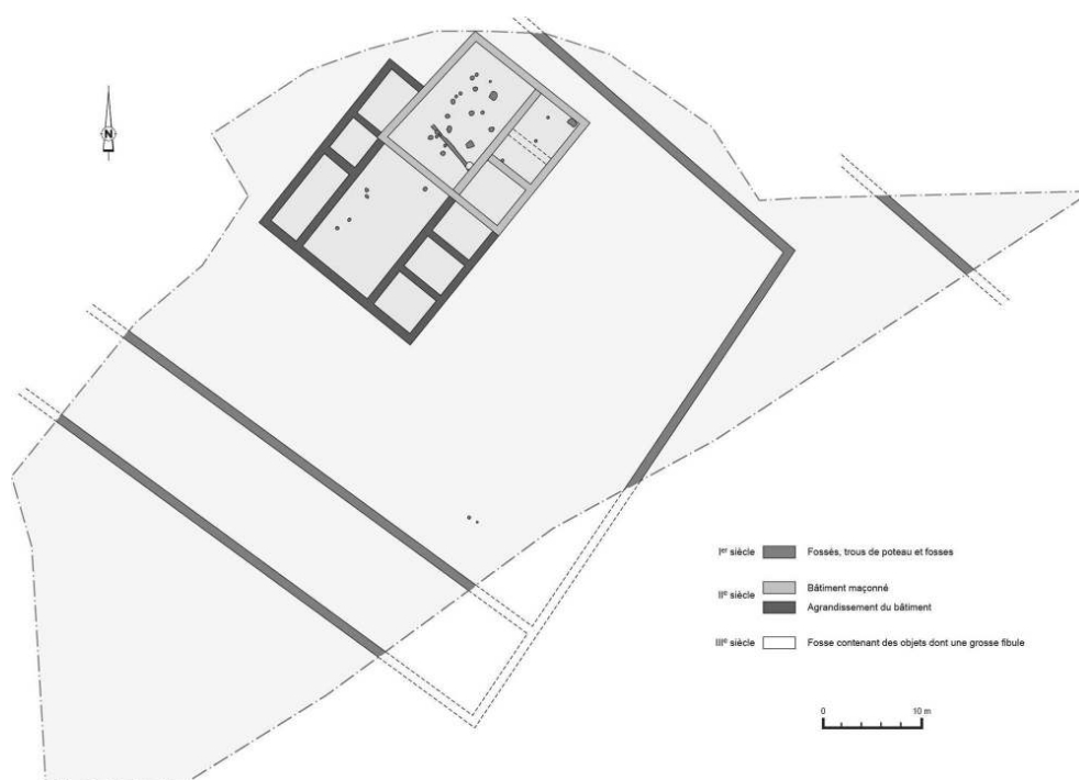
Fig. 3 – Plan général légendé par phases des structures

Relevés topographiques : J. Berthet; DAO : C. Goy (Inrap).