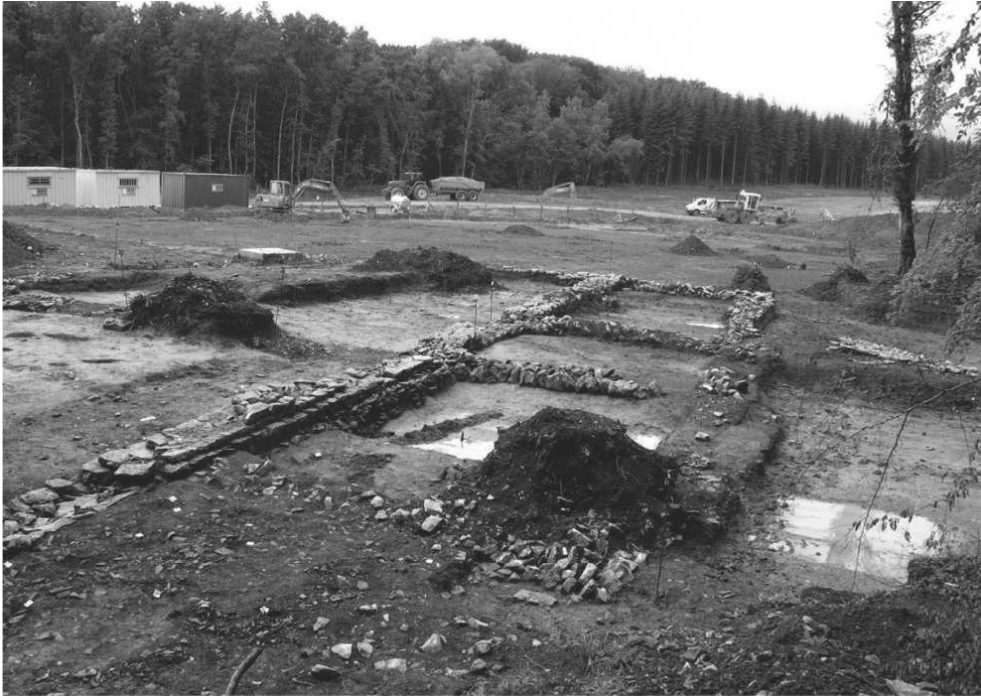
Fig. 1 – Vue générale du bâtiment (montage)