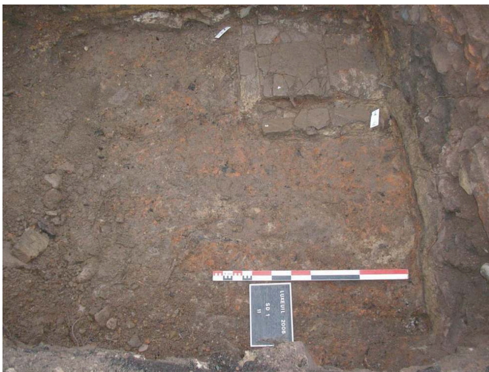
Fig. 1 – Sondage 1 : foyer avec plaquette et sol rubéfié