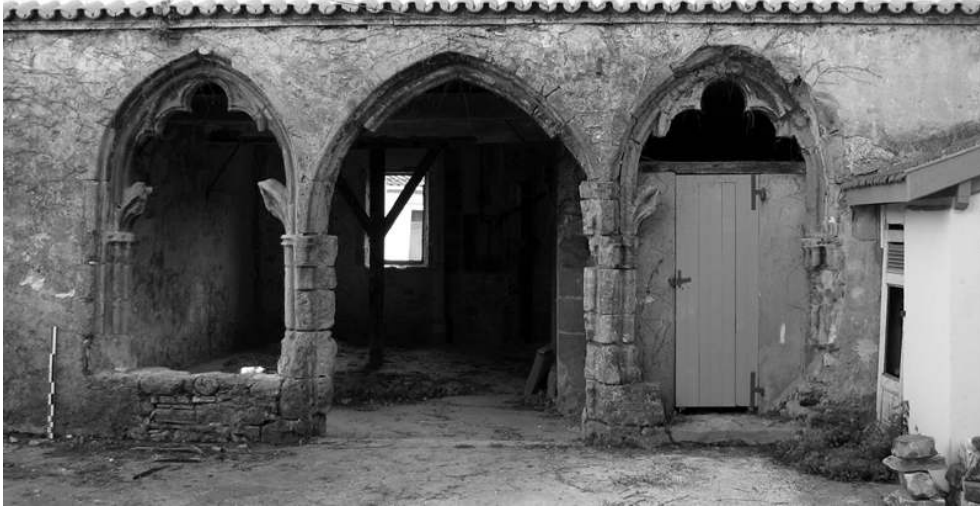
Fig. n°2 : Baies du rez-de-chaussée de la façade occidentale du bâtiment C

Auteur(s) : Bouvard, P. (Hadès). Crédits : Bouvard P., Hadès (2008)