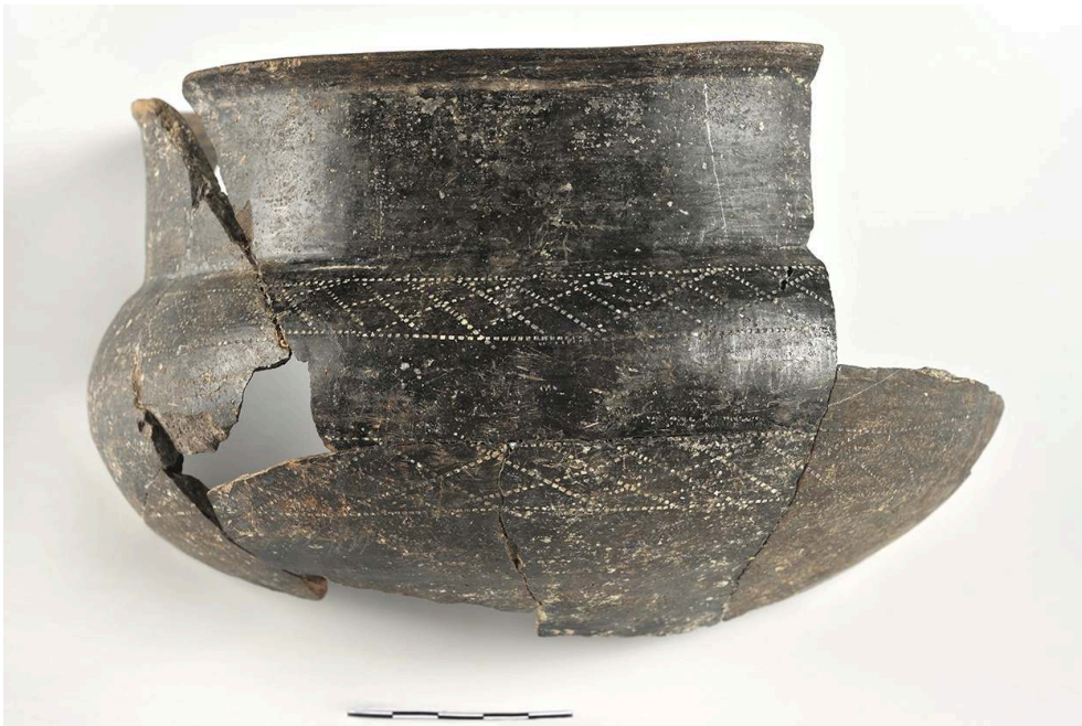
Fig. 2 – Céramique

Topographie : D. Fillon ; DAO : J.-M. Bryand (Inrap).