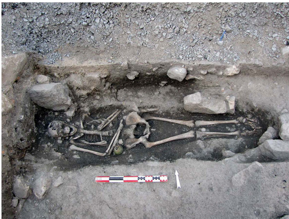
Fig. 3 – La sépulture SEP 22