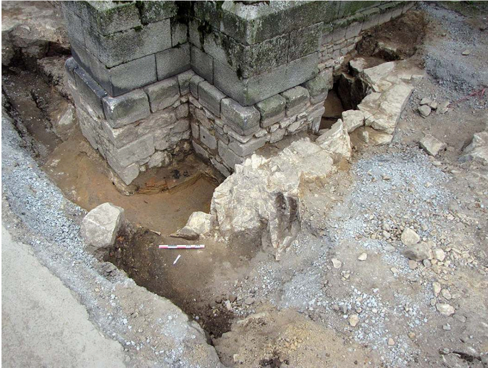
Fig. 2 – Les deux hypothétiques moules à cloche