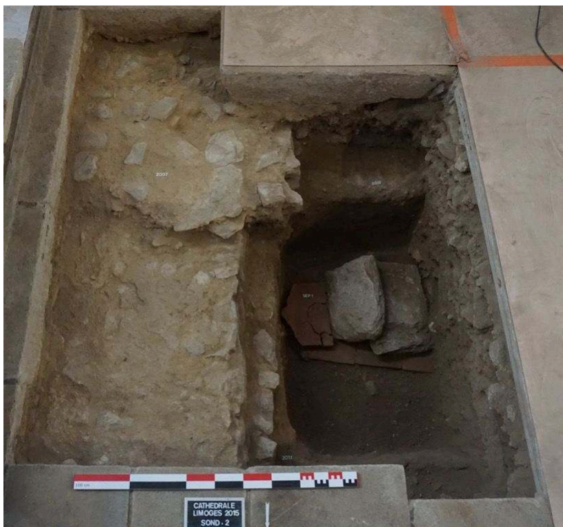
Fig. 3 – Vue d'ensemble du sondage 2 : emmarchement et tombe en Coffre