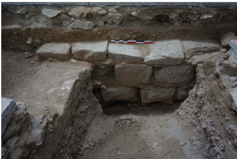
Fig. 2 – Vue du parement nord du caveau identifié dans le sondage 1

de Langeac recueillis dans la fosse et dans les glissements de terre qui débouchent dans la salle centrale de la crypte 2 .