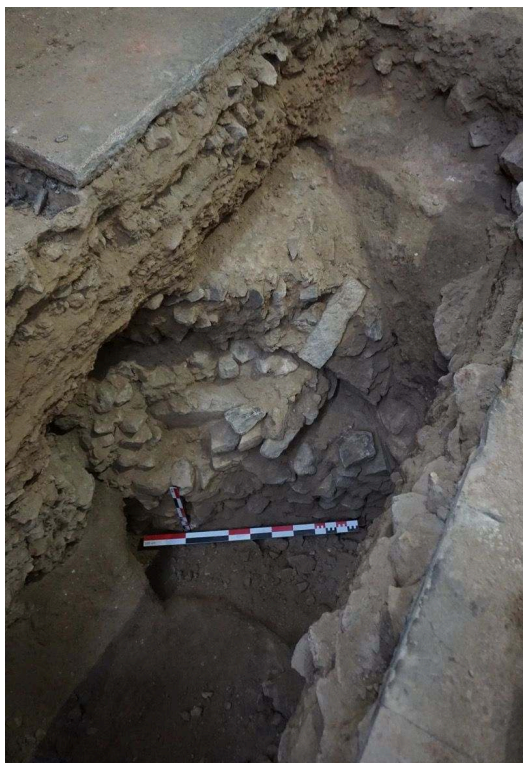
Fig. 4 – Vue depuis l'est du mur de fermeture du déambulatoire (côté sud) de la crypte

remonte vers l'intrados de la voûte. Si le deuxième état de voûte en berceau reprend au nord les arases de l'ancienne voûte, la retombée de la voûte au sud n'a pu être appréhendée en raison des limites restreintes du sondage. Cette seconde campagne n'aura toujours pas permis de savoir si le mur externe du déambulatoire subsiste.