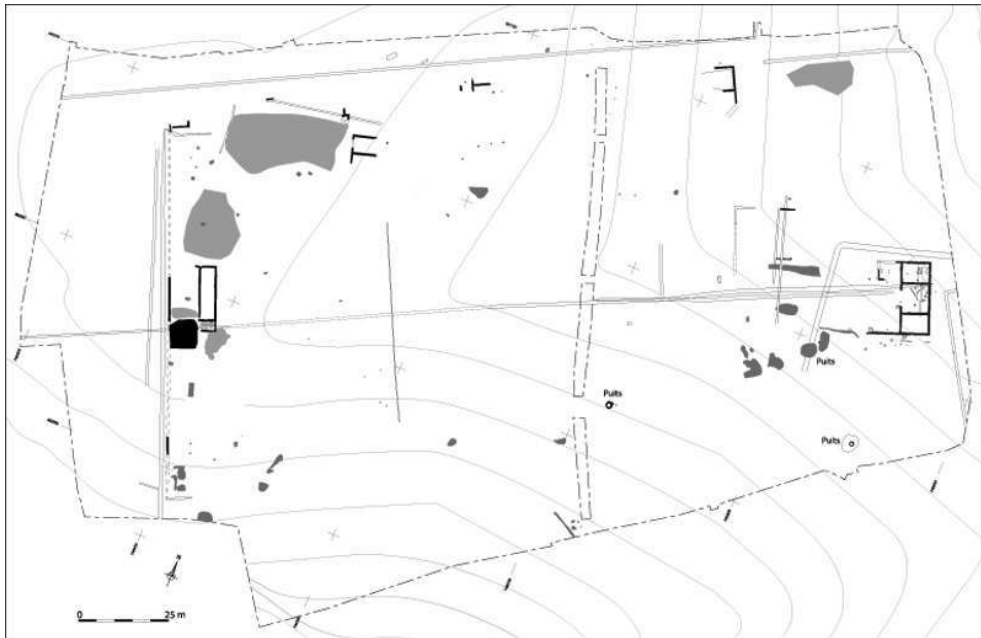
Fig. n°2 : Vestiges antiques

Néronde - Les Désampés - Structures de la période antique (DAI) : T. Argant, 2010.