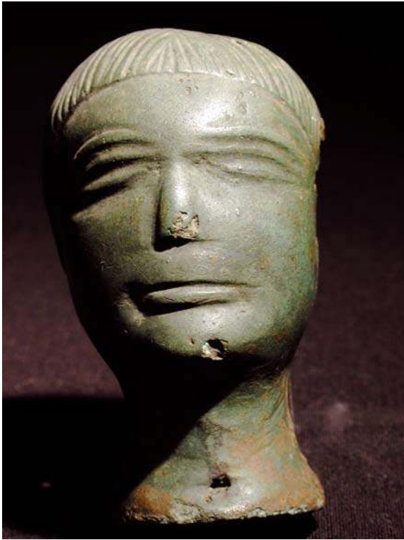
Fig. n°2 : Digulleville : statuette en bronze gallo-romaine

Auteur(s) : Yvon, J.-M.. Crédits : Yvon, J.-M. (2009)