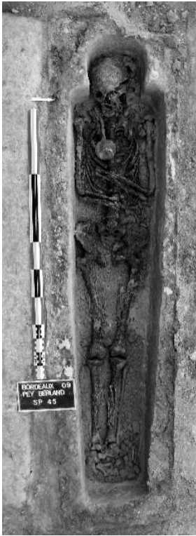
Fig. n°2 : Sépulture 45

Auteur(s) : Demangeot, C. (Hadès). Crédits : C. Demangeot, Hadès (2009)