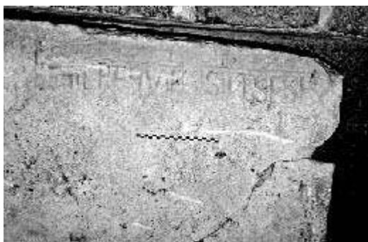
Fig. n°2 : Dalle funéraire présentant une inscription

Auteur(s) : Jaubert, Bernard ; Fizellier-Sauget, Bernadette. Crédits : Fizellier-Sauget Bernadette (cliché) ; Jaubert Bernard (DAO) (2006)