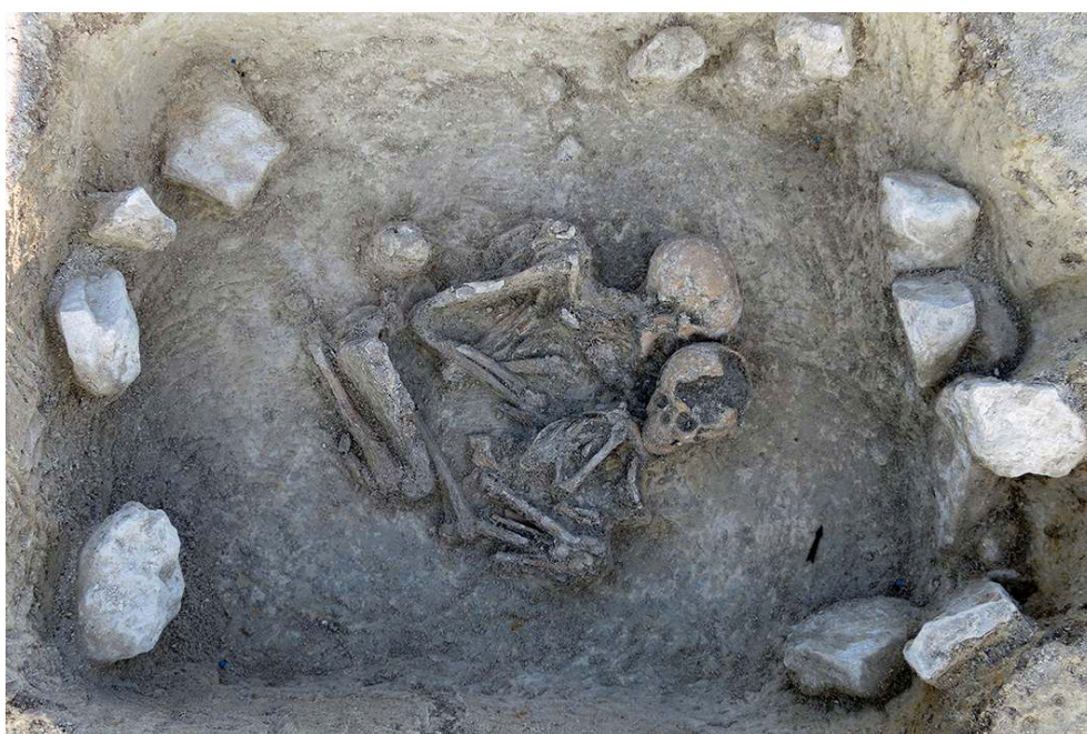
Fig. 2 – Aménagement de blocs en périphérie d'une fosse contenant deux inhumations

reposent tous en position globalement fœtale sur le côté gauche, et ce, quelle que soit la taille du creusement. La tête est orientée grosso modo à l'est. Les membres inférieurs sont fléchis à hyperfléchis. Les individus sont inhumés au sein de contenants souples, rigides, voire mixtes. L'étude des données biologiques a été fortement limitée par l'état de conservation des squelettes. Ce sont seulement 14 femmes et 7 hommes qui ont été identifiés sur un nombre total d'individus matures de 68. L'analyse du recrutement funéraire sur les individus immatures a montré un déficit des plus jeunes (périnataux et 1-4 ans) ainsi que pour les adolescents (15-19 ans). A contrario , les individus de la classe [5-9] ans montrent un surnuméraire. La population sort donc des schémas classiques des mortalités préjennériennes. L'étude paléopathologique a également été fortement conditionnée par l'état des ossements; elle a montré que les individus avaient globalement une bonne hygiène bucco-dentaire.