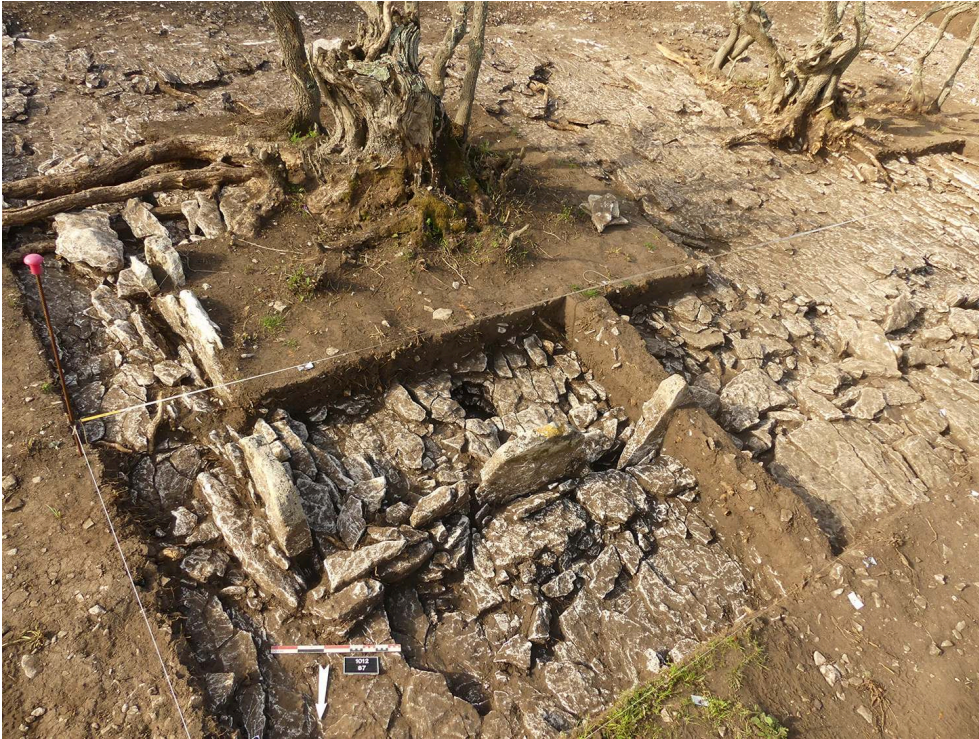
Fig. 1 – Structure bâtie US 1012, habitation rectangulaire du Néolithique récent, depuis le nord